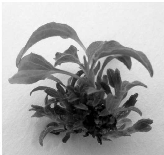
Рис. 1. Адвентивное побегообразование в культуре сегментов побега клематиса сорта Crystal Fountain на среде, дополненной 6 мкМ ТДЗ

На среде МС, содержащей 9,0 мкМ ТДЗ, получено в среднем 11,9 \pm 1,9 микропобегов/эксплант у сорта Альпинист, 9,0 \pm 2,0 у сорта Crystal Fountain, 6,0 \pm 1,0 – у сортов Никитский Розовый и Madame Julia Correvon, 5,0 \pm 1,0 – у сорта Бал Цветов. Длина микропобегов составила 1,7 \pm 0,04 – 1,9 \pm 0,04 см, а количество междоузлий – 4,0 – 4,6 \pm 0,2 шт./побег. Адвентивные микропобеги были компактные и визуально не имели морфологических отклонений; в дальнейшем их можно было использовать для микро-черенкования in vitro (рис. 2).