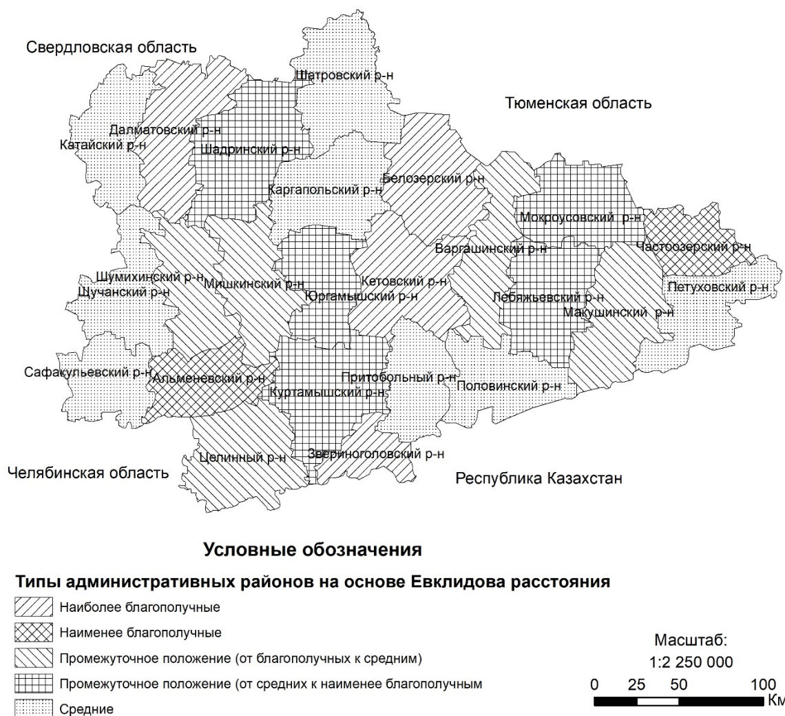
Рис. 2. Типы административных районов Курганской области