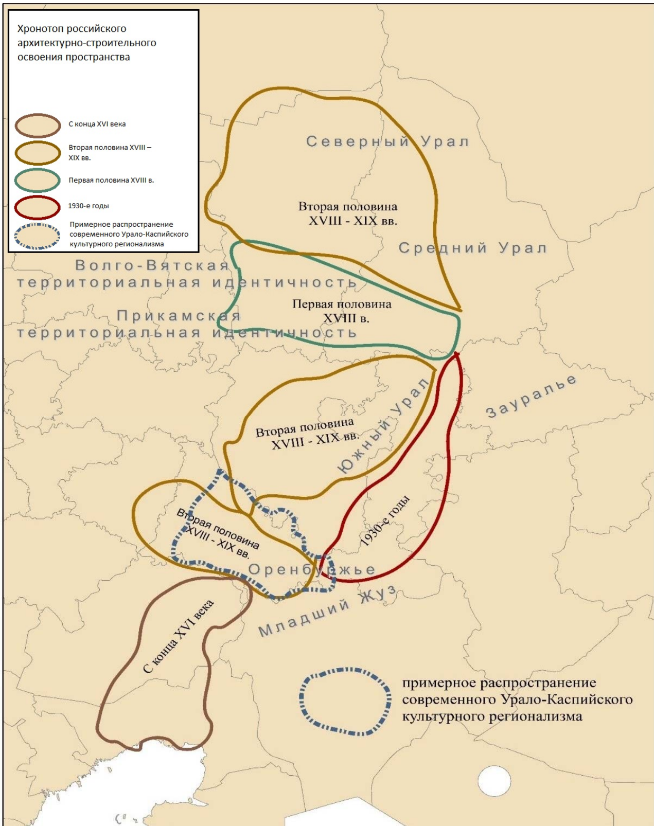
Рис. 2. Идентификация Урало-Каспийского региона в структуре хронотопов Большого Урала

С опорой на материалы современных фольклористов можно определить русскую культуру в регионе как «бинарную», соединяющую западные и восточные элементы [19].