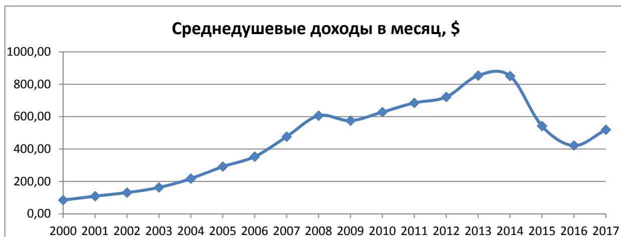
Рис. 2. Динамика изменения доходов населения России

ни в одной развитой стране. Во-вторых, среднедушевой уровень доходов населения в последние годы имеет тенденцию к снижению, тесно коррелируя с уровнем ВВП страны (рис. 2).