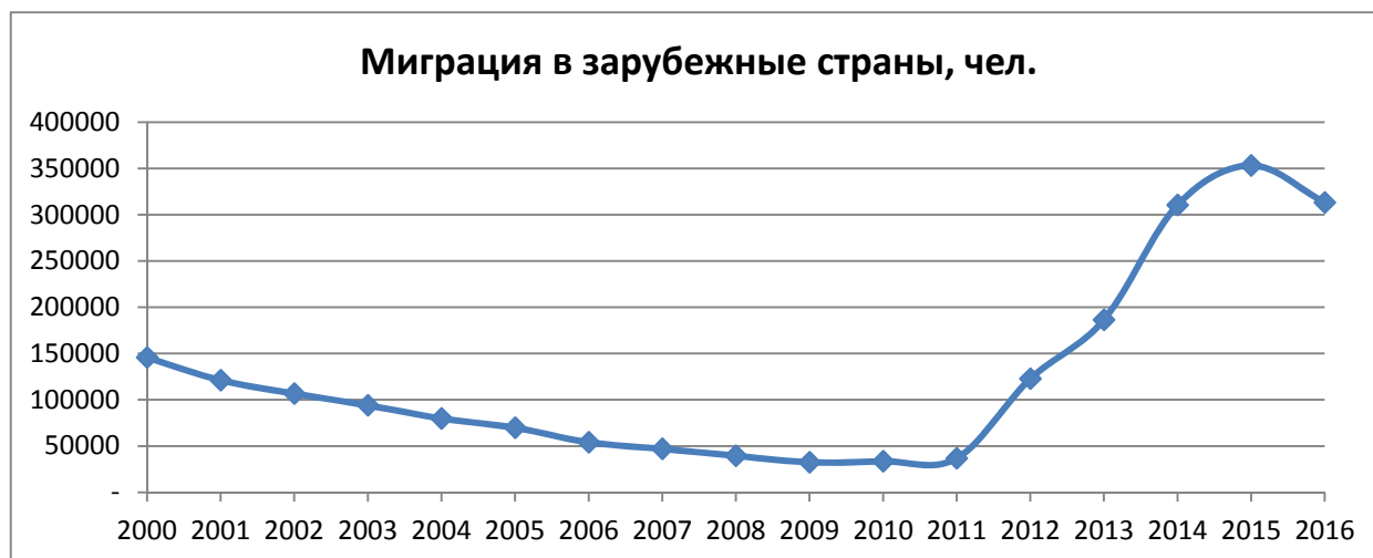
Рис. 4. Миграция населения России в зарубежные страны

Степень удовлетворенности населения качеством и эффективностью государственного управления отражается через комплекс поведенческих показателей людей, характерных для страны в целом (уровень федеральной власти) или ее отдельных регионов (уровень регионального управления). Граждане страны, не удовлетворенные качеством принимаемых решений и низкой эффективностью управления, вынуждены принимать различные меры для поддержания уровня своей жизни и удовлетворения своих духовных и материальных потребностей. Наиболее ярким свидетельством неудовлетворенности людей качеством управления является отток граждан из страны. На рис. 4 показана динамика миграции граждан из России.