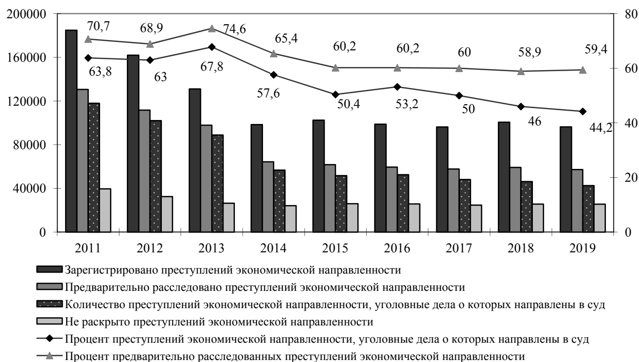
Рис. 2. Оценка экономической преступности в Российской Федерации с позиции раскрываемости за 2011–2019 гг.

Оценка динамики показателей, характеризующих процент предварительно расследованных преступлений экономической направленности и количества преступлений экономической направленности, уголовные дела о которых направлены в суд, позволяет сделать вывод о сложившейся устойчивой тенденции сокращения доли зарегистрированных преступлений, получающих оценку в суде (до уровня менее 45 %, хотя ранее их доля составляла 64–68 %) (рис. 2). Так, за последние годы наблюдался рост более чем на 5 % доли нераскрытых преступлений экономической направленности, снижение более чем на 10 % предварительно расследованных преступлений, сокращение почти на 20 % доли преступлений экономической направленности, уголовные дела о которых направлены в суд.