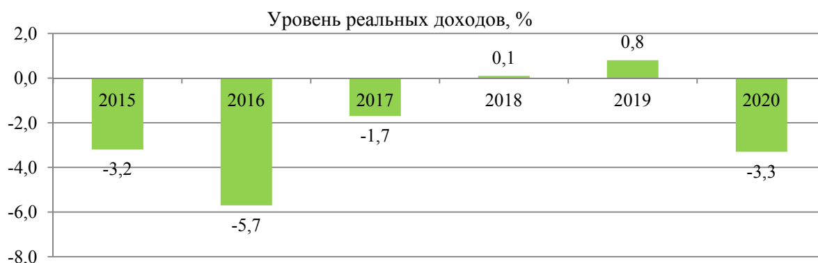
Рис. 2. Уровень реальных располагаемых доходов населения РФ за 2015–2020 гг., в % к предыдущему году

Какова же причина отсутствия очевидной тенденции роста качества жизни граждан страны от повышения такого показателя материального благосостояния населения, как ВВП? Уровень реальных располагаемых доходов населения Российской Федерации представлен на рис. 2.