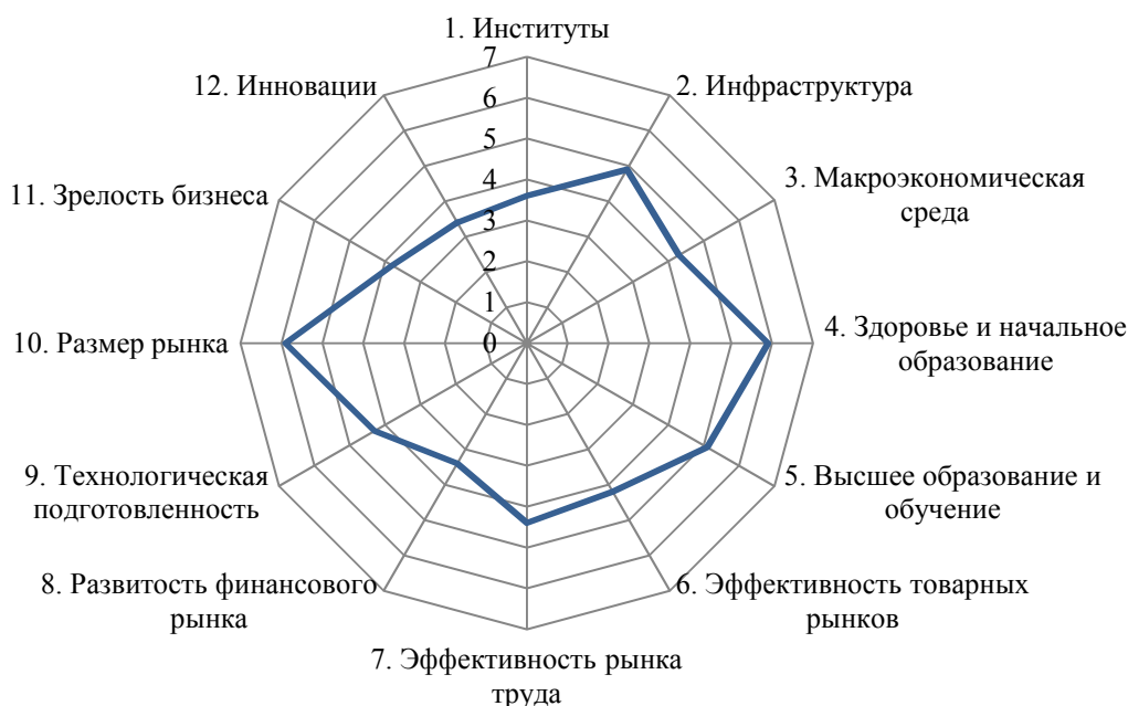
Рис. 2. Эннеаграмма факторов индекса глобальной конкурентоспособности России по данным Всемирного экономического форума за 2019 г. [7]

Эннеаграмма факторов индекса глобальной конкурентоспособности России представлена на рис. 2.