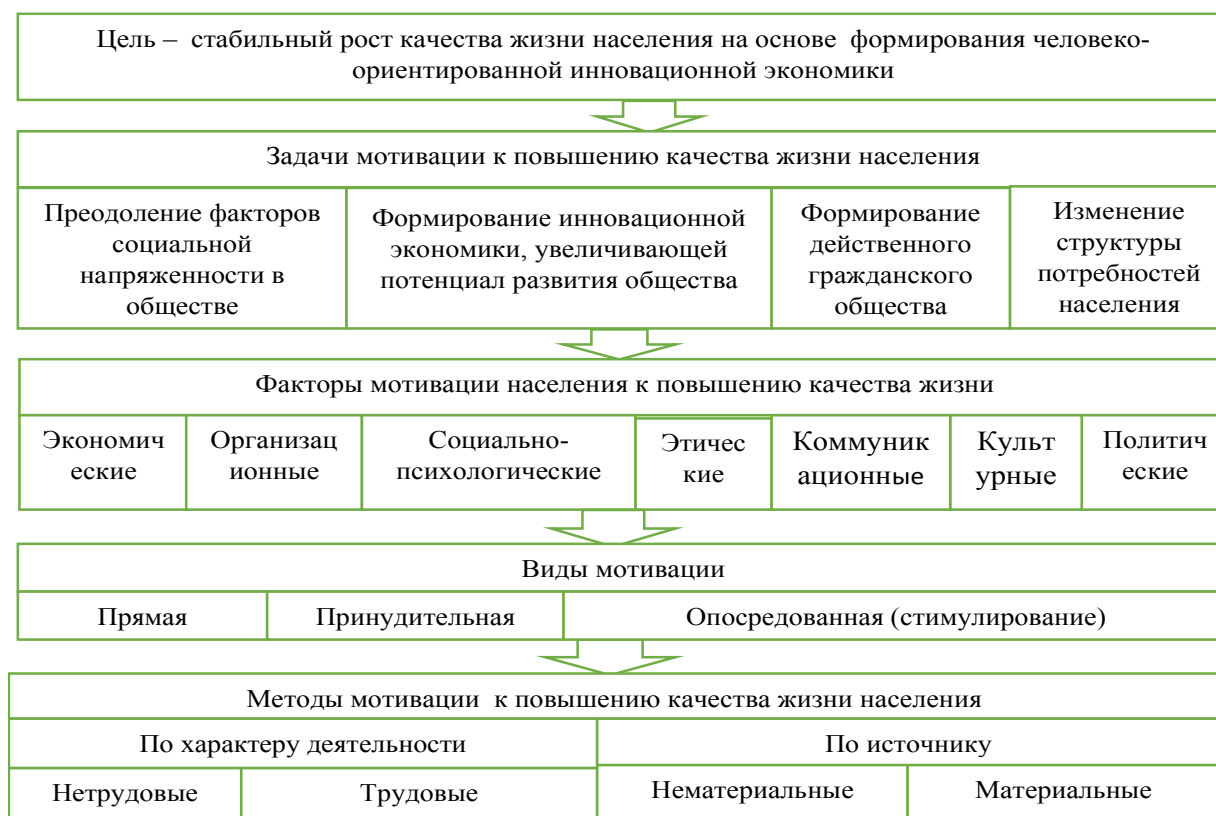
Рис. 2. Методология мотивации населения к повышению качества жизни населения*

Формирование методологии мотивации населения к повышению качества жизни населения. Сегодня все большее значение приобретает нетрудовая мотивация, реализуемая среди неработающего населения, либо у работающих граждан, но в свободное от работы время. Методология формирования населения к повышению качества жизни включают следующую структуру, которая представлена на рис. 2.