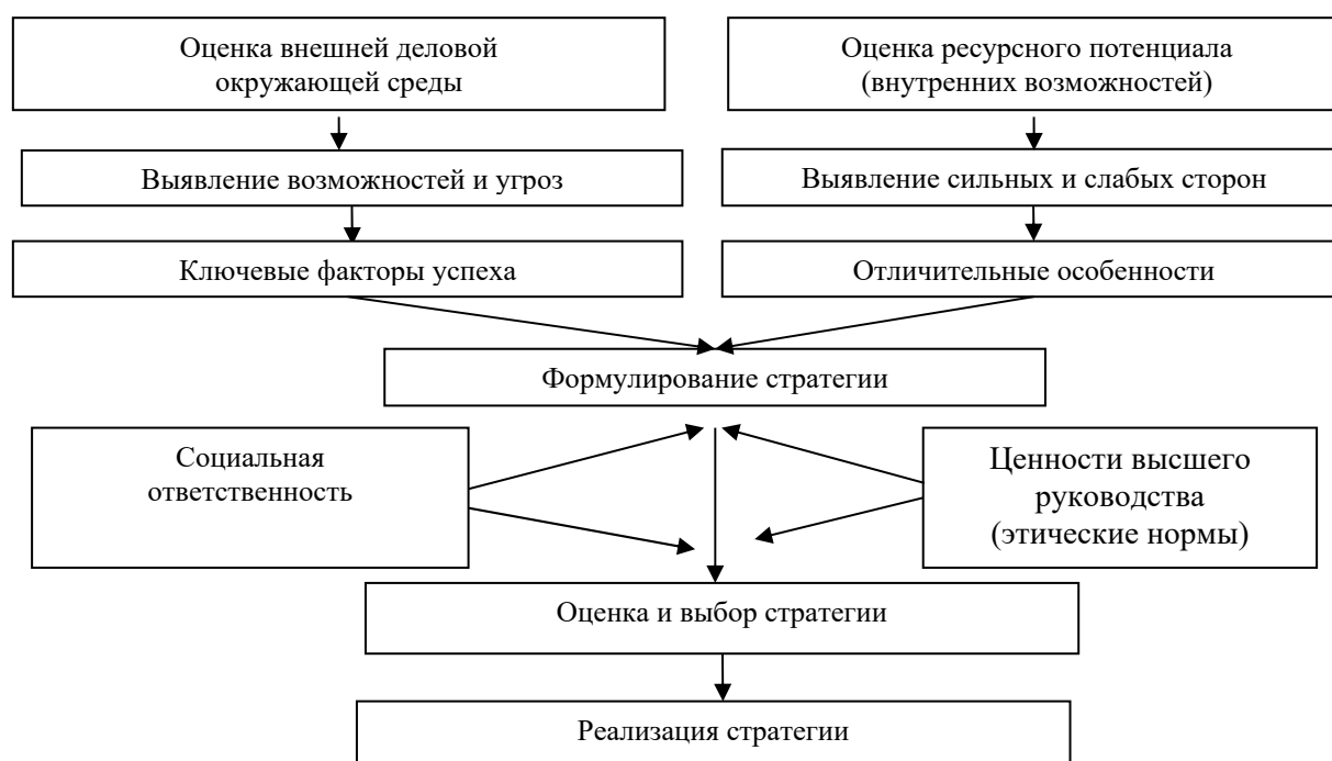
Рис. 1. Модель Гарвардской школы бизнеса [5]

Следует отметить, что Гарвардская школа бизнеса разработала и предложила использовать менеджерам компаний метод SWOT-анализа при конструировании стратегии развития бизнеса (рис. 1).