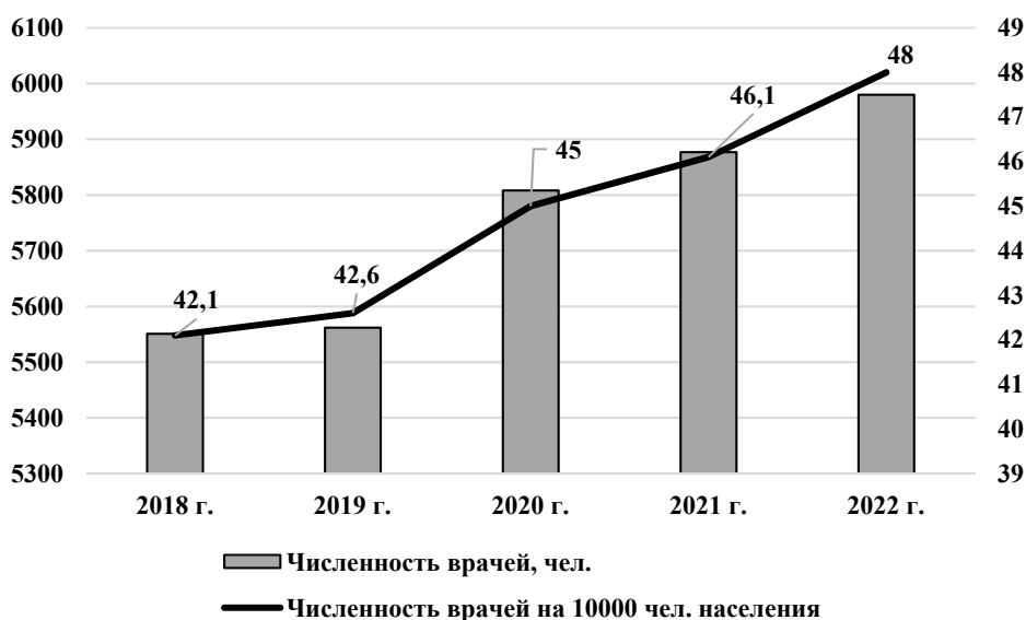
Рис. 2. Численность медицинских кадров [11-12]

Наблюдаемый рост численности врачей на 10000 населения (рис. 2) в определенной мере связан не только с увеличением числа специалистов, но и со снижением численности населения Пензенской области с 1305,6 тыс. чел. в 2018 году до 1246,6 человек в 2023 году. Кроме того, в Пензенской области, несмотря на принимаемые меры, на протяжении ряда лет наблюдается дефицит врачей, при чем как узких специалистов, так и участковых терапевтов. Особо остро стоит проблема обеспеченности медицинских организаций педиатрами. Так, за 2023 год рост числа вакансий врачей педиатров в регионе составил 39 %. Таким образом, на Пензенскую область приходится примерно один процент всех вакансий педиатра в стране. Средняя зарплата детских врачей в Пензенской области составляет 58 тысяч рублей [10].