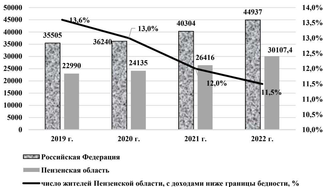
Рис. 4. Денежные доходы в расчете на душу населения, руб. в месяц [19-22]

конец 2022 года 9996 семей Пензенской области стояли на учете в качестве нуждающихся в жилье. С учетом того, что в год жилье получают в среднем 500-700 семей нуждающихся, можно предположить, при условии сохранения данной тенденции, сроки ожидания жилья могут составлять более десяти лет [19].