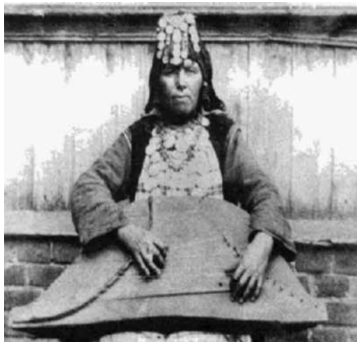
Рис. 2. Фото исполнительницы на крезе из издания***