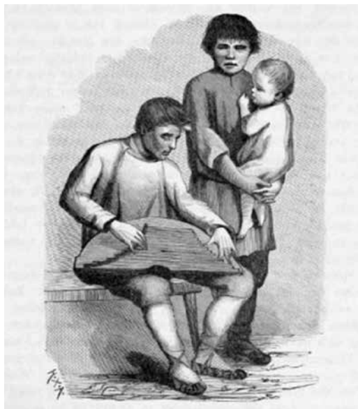
Рис. 1. Изображение из публикации**

Таким образом, зафиксированные на фонограф Я. А. Эшпаем и М. П. Петровым гусельные наигрыши удмуртов представляют собой ценнейший материал, поскольку являются первыми и более полными в отечественной науке звукозаписями этого инструмента, многие из которых не были повторены в более позднее время.