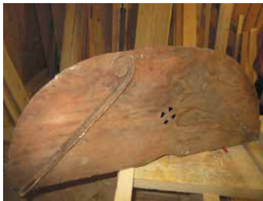
Фото 1. Быдзым крезь***

Общепринято мнение, что Быдзым крезь отличается от бытового крезья большими размерами и количеством