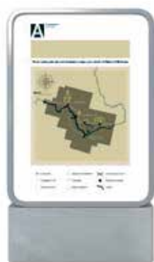
Илл. 11. Лайтбокс

Вот как выглядит стандартный информационный лайтбокс, подобранный в соответствии с общей стилистикой всех МАФ (илл. 11).