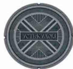
Илл. 10. Рисунок смотрового колодца