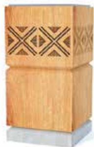
Илл. 9. Уличная урна