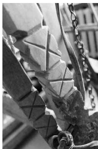
Илл. 1. Элемент ткацкого стана с контурной резьбой

Часто встречается контурная резьба на плоскости, выполненная резцом. «Резной орнамент – пояс из косых крестов – самый распространенный декоративный элемент в искусстве коми» [Шургин 2009]. Узоры в виде параллельно идущих полосок, зубцов и елочек образуют в разнообразных комбинациях геометрические фигуры: квадрат, косой крест, круг, звезду (илл. 2). Насечки, которые имели характер утилитарности и наносились для того, чтобы уберечь дерево от растрескивания при