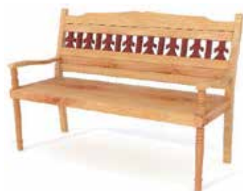
Илл. 7. Скамейка