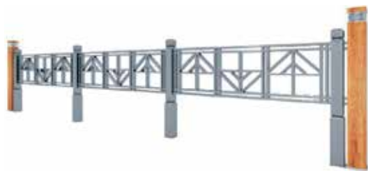
Илл. 8. Ограждение в составе с фонарем