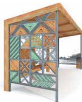
Илл. 5. Остановка в с. Усть-Кулом

В свою очередь, крышка смотрового колодца, на наш взгляд, имеет определенное значение в средовой уличной композиции, поскольку это обязательный технический предмет, в связи с чем дизайну люка решено было тоже уделить внимание: крышка демонстрирует рельеф орнамента коми с надписью «Усть-Кулом» – подходящим стилизованным шрифтом (илл. 10).