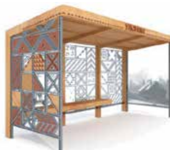
Илл. 6. Остановка в с. Ульяново