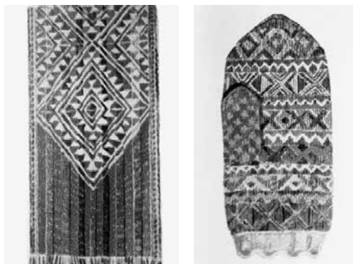
Илл. 3. Вязаный пояс и варежка с диагонально-геометричным орнаментом

высыхании, «превратились» в «орнаментальную порезку, оживляющую ровную гладь изделия» [Белицер 1958].