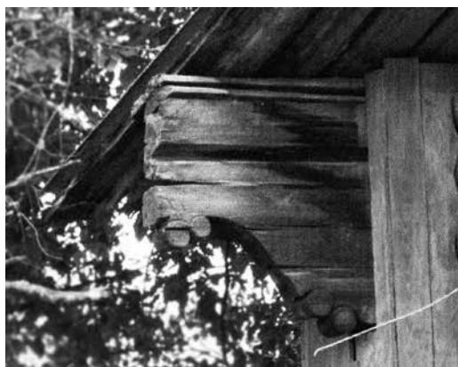
Рис. 4. Кронштейн. с. Важгорт Удорского р-на Республика Коми. 2009 г. [Чудова 2013]

Скульптурной резьбой украшали и объемы комлевых частей куриц, которые выступали из-под свеса крыши и поддерживали потоки (водотечники, водоотводы). Г-образные окончания скульптурно вырезали и придавали им вид стилизованных образов птиц, точнее их передней части: головы и грудной части корпуса. Заметим