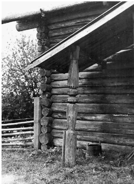
Рис. 1. Поддерживающий кровлю крыльца столб. Республика Коми, Сысольский р-н, д. Шорыйв. 1973 г. Фото И. Н. Шургина. [Зырянский домострой, Э/р]

Архитектурно-художественная (декоративная) выразительность дома подчеркивалась входной группой – крыльцом, все элементы которой представляли единую, гармоничную, функциональную объемно-пространственную композицию. Деревянная конструкция крыльца состояла из огороженной или открытой площадки, которую формировали на одном, двух или четырех вертикально врытых в землю опорных столбах-бревнах на высоте уровня напольного покрытия сеней и жилого помещения. Лестницу, врубленную в обвязку площадки, ориентировали параллельно либо перпендикулярно стене дома и доводили до земли примерно под углом 45°. Основанием площадки могла быть и срубная конструкция, возведенная и выполненная с одной из внешних сторон как лестница, где ступеньками служили обтесанные в виде бруса или расколотые и перевернутые горбушкой вниз бревна. Функцию навеса крыльца несла дощатая кровля, которая в зависимости от предпочтений домохозяев, могла иметь односкатную, двускатно-симметричную или двускатно-асимметричную форму. Стык двух скатов кровли прикрывался охлупнем. Кровля поддерживалась на столбах, поставленных по углам площадки, а у двускатно-асимметричной крыши крыльца длинный скат был оборудован дополнительным опорным столбом (рис. 1).