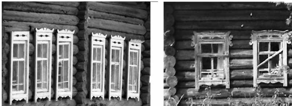
Рис. 3. Декорированные наличниками окна. Сысольский р-он Республики Коми [Некрасов 2014, 68]

напоминает геометрию закрытого объема горизонтально лежащей треугольной призмы, представленной в виде двухскатной крыши из теса. С художественной точки зрения, интерес вызывают декоративно-конструктивные детали переднего фасада верхней части избы. К ним относят кронштейны (консоли), курицы, причелины, князевую слегу и охлупень. Так, кронштейны, состоящие из связки