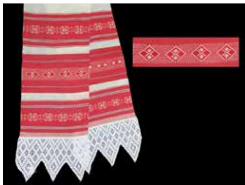
Рис. 13. Полотенце – новодел. Изготовлено по образцу северно-удмуртского полотенца. См. рис. 14. Фонды Центра ремесел г. Глазова