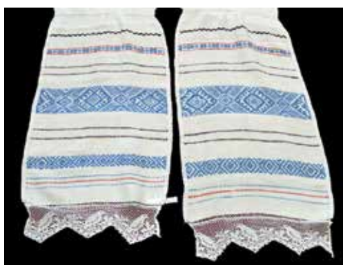
Рис. 12. Полотенце с концами браного ткачества из белых и голубых нитей. Обрядовая принадлежность остается под вопросом. Центральное полотно выткано в технике узорного многоремизного ткачества «белым по белому». Северные удмурты. Середина XX в. Длина – 340 см. Фонды ГKM. 4425-ГKM

вилось похоронным, а одно – устремленным ввысь. Полотенце – символ пути, связывающего «этот» и «тот» свет. Это путь светлых, праведных душ; по верованиям удмуртов, после земной жизни боги забирают их на небеса. На косяк окна вывешивалось специальное полотенце – у чаши с водой, которая ставилась на подоконник, чтобы душа умершего могла умыться и утереться (рис. 10).