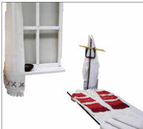
Рис. 10. Экспозиционный комплект «Третья свадьба» выставки «Вся жизнь на полотенце».

2. Почему на полотенцах из приданого пришиты тесемки, кисточки с пуговицами? Ответ: от сглаза, «чтобы рука не ушла» (то есть, чтобы женщина не потеряла свое мастерство) и в знак того, что этот узор позаимствовала другая мастерица. Сколько кисточек (тесемок), столько раз был снят узор.