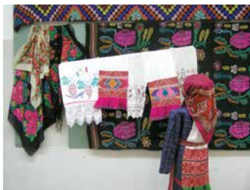
Рис. 8. Экспозиционный комплекс «Свадьба. Южные удмурты». Полотенца из приданого невесты, вывешенные на свадьбе на обозрение в доме жениха