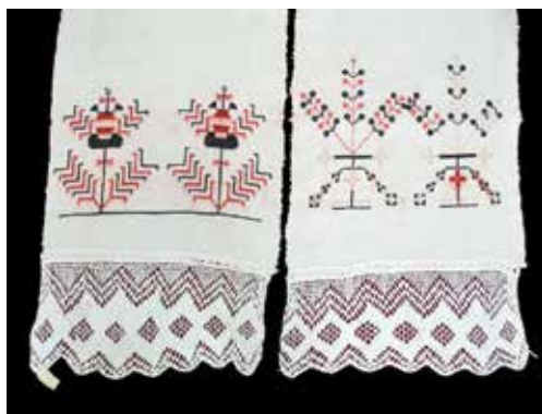
Рис. 7. Полотенце с разными концами из приданого невесты. Изготовила Жуйкова Варвара Валентиновна, удмуртка, 1878 г.р., ур. д. Зилай Глазовского уезда. Вышивка крестом на льне. Северные удмурты. Нач. XX в. Длина 280 см. Фонды ГKM. 3130-ГKM