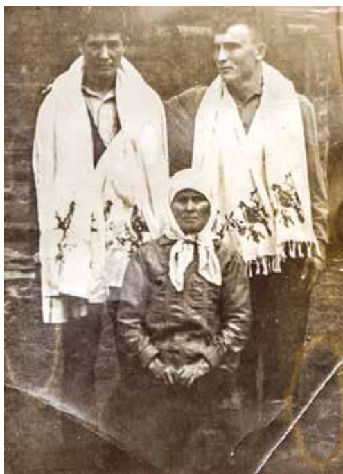
Рис. 3. На юношах – полотенца, подаренные при проводах в армию. Глазовский р-н УАССР. 1960-е гг.

с вышитыми крестами (рис. 2). Это полотенце человек хранил всю жизнь как оберег, как семейную реликвию. Бабушке-повитухе на крестинах также дарили отрез холста и полотенце [Герд 1997, 265]. В обряде крещения полотенце являлось символом мира культуры. Когда ребенка клали на полотенце, признавалось, что человек из мира природы вступал окончательно в мир культуры, становился членом общества [Лысенко, Комарова 1992, 19].