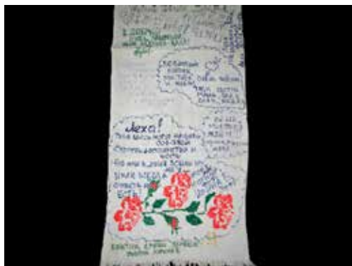
Рис. 4. Полотенце вышитое, подаренное призывнику при проходах в армию. Д. Золотарёво Глазовского р-на Удмуртской Республики. 1980-е гг. Принадлежит Булдаковой Елене Михайловне, жительнице д. Золотарёво Глазовского р-на УР