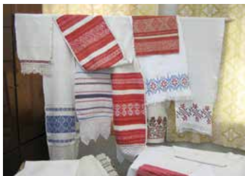
Рис. 5. Экспозиционный комплекс «Свадьба. Северные удмурты». Полотенца из приданого невесты, вывешенные на свадьбе в доме жениха на обозрение – обычай «дйсь ошон» («вывешивание одежды»). В центре – красно-белое полотенце с разными концами, расположенными друг под другом

Полотенце было и символом пожелания счастливого пути. До сих пор в севернoudмуртских деревнях и в г. Глазове существует этот обычай. Еще в 1990-е гг. иногда призывнику дарили вафельные полотенца с вышитым в технике «крест» растительным орнаментом (ЗПМ). С 90-х гг. чаще используют уже обычные, без вышивки, полотенца, часто покупные белые вафельные и даже махровые. С 1980-х гг. по сегодняшний день в удмуртской деревне и в г. Глазове живет традиция: провожающие (молодежь) оставляют на полотенце надписи – пожелания (ЗПМ, 4ПМ, 5ПМ) (рис. 4).