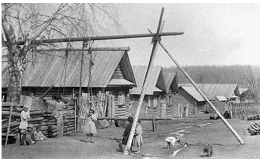
Удмуртские весенние качели (из собрания Казанского Госуниверситета [опубл.: Коробейников 2006, 46])

Термин «качельные напевы» в кукморской традиции, на наш взгляд, связан не столько с пением во время качания (что, однако, не исключается), сколько с централизующей идеей плодородия, возрождения, воплотившейся в раскачивании. Качели, безусловно, были и долгое время оставались главным компонентом обрядового действия, основным развлечением молодежи на месте игр. Поощрялась та пара, которая взлетала выше всех. Но с учетом высоты качелей (до 6–8 м) и амплитуды раскачивания (до 10–12 м) становится понятным ответ песельниц о невозможности петь во время качания. Поэтому термин «качельные песни» для носителей традиции скорее означает пение на лугах около качелей.