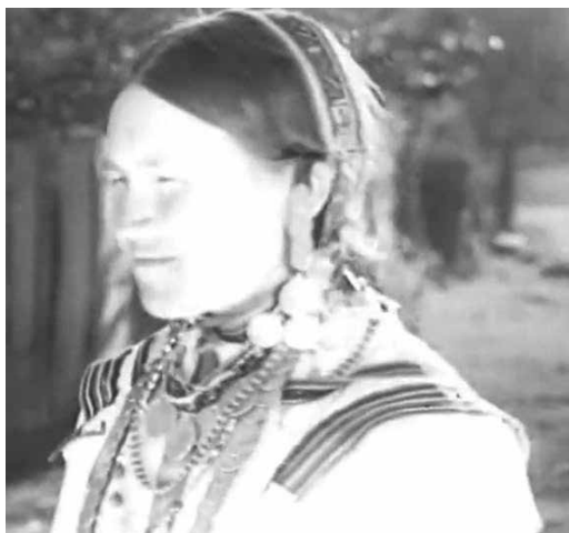
Рис. 2. Кадр из фильма «Марийцы» (1928)

Анализируя видеоряд фильма в целом, мы можем наблюдать следующую последовательность: тяжелый труд, сопровождающийся «непонятными ритуалами» – переименование и строительство нового города с каменными зданиями – работа по духовному и физическому оздоровлению населения – и потом, после «излечения», – новый труд, более комфортный и эффективный (строительство лесозаводов, новые ткацкие станки, производственные артели, кружки и кооперативы).