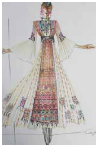
Рис. 2. Сценический костюм исполнительницы удмуртских песен Татьяны Шкляевой