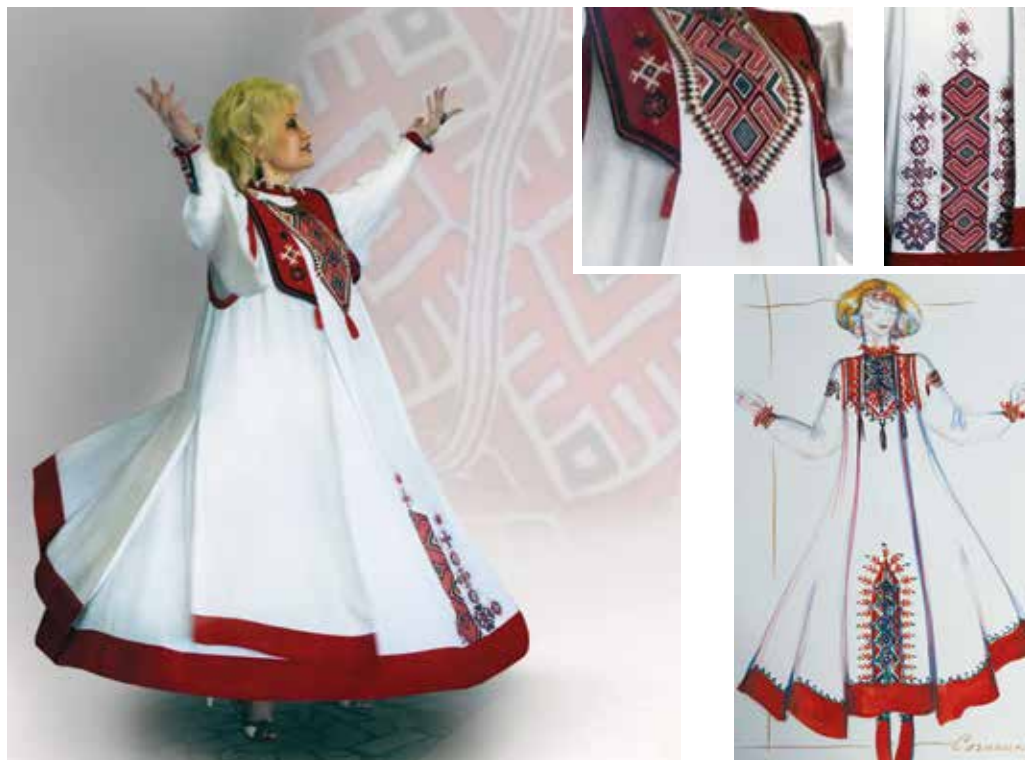
Рис. 4. Сценический костюм Валентины Пудовой. Фото И. А. Сазыкиной

Удмуртский женский костюм с его традиционными принципами формообразования и декорирования, основанными на многовековом мировоззрении удмуртского этноса, бесспорно, значительно отличается от современного сценического костюма. Можно говорить, что в национальном удмуртском костюме идея максимальной материализации традиционного сакрального содержания превалирует над отражением особенностей конкретной личности носящей костюм женщины. При формировании же яркого сценического образа учет фактора личности конкретного исполнителя крайне важен, и художник по костюму должен найти то композиционно-смысловое решение, адаптированное к традициям удмуртской культуры, которое в комплексе с уникальной личностью исполнителя и исполняемым произведением создало бы незабываемый цельный сценический образ. Именно такие образы мы можем видеть в исполнении Народной артистки Удмуртии Валентины Пудовой и созданные в тандеме с художником по костюму Ириной Сазыкиной (Рис. 4).