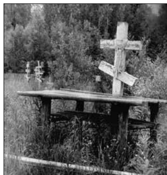
Фото 2. Поминальный крест на деревенском кладбище. Республика Коми, Усть-Куломский р-н, с. Мыелдино. 2001 г.