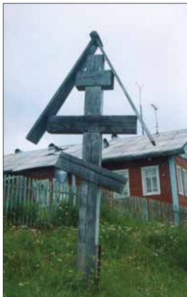
Фото 11. Крест иконе «Богородице Неопалимая Купина». Республика Коми, Удорский р-н, с. Муфтюга. Фото А. А. Чувьорова. 2002 г.