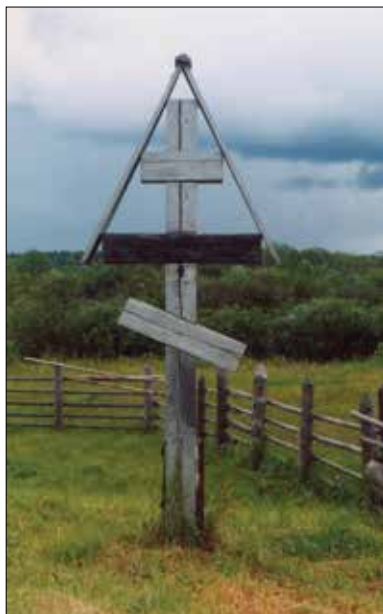
Фото 10. Крест св. Николаю Чудотворцу. Республика Коми, Удорский р-н, с. Муфтюга. 2002 г.

между обетными и охранительными крестами состоит в том, что если первые устанавливаются в память о реально происшедшем бедствии и нередко непосредственно в момент кризиса (как средство, способствующее его преодолению), то вторые не привязаны к конкретному факту, их роль профилактическая – защита от бедствий. Два креста этого типа зафиксированы Т. А. Крюковой в 1935 г. во время экспедиции в Усть-Куломский р-н: обетный крест в селах Дон и Усть-Нем. В коллекционной описи к фотографии из с. Дон (фото 8) имеется следующая запись: «Крест деревянный, восьмиконечный, врытый в землю, стоит у задней стены деревянной избы, около изгороди. <...> Такие кресты в дореволюционное время ставились хозяевами (во дворе, около дома или на поле) “по обету”, якобы для излечения от болезней или для отогнания нечистой силы от дома (например, в случае если в доме “чудится”, т. е. слышатся непонятные звуки); во время крестных ходов около таких крестов служили молебны с водосвятием» [1. № 44/1,2]. Такую же форму имел и крест из с. Усть-Нем и установлен для тех же целей: для защиты сельской округи от различных бедствий [1. № 45]. Судя по фотографиям, надписи на этих крестах отсутствовали.