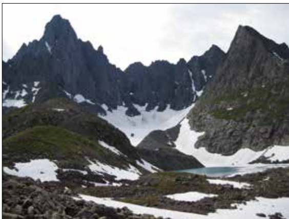
Фото 14. Гора Сабля. Приполярный Урал. 2011 г.

Особым почитанием, как отмечает Б. В. Бессонов, у печорских коми пользовалась также гора Сабля (1497,4 м – фото 14). Саблинский хребет в ясную погоду виден на значительном расстоянии по реке Печоре. Многие печорские