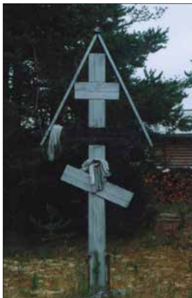
Фото 9. Крест Михаилу Архангелу. Республика Коми, Удорский р-н, с. Муфтюга. 2002 г.