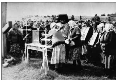
Фото 3. Молебен с водосвятием возле памятного креста на месте часовни иконы Тихвинской Божьей Матери. Республика Коми, Усть-Куломский р-н, с. Мыелдино. 2001 г.