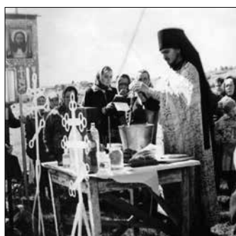
Фото 5. Молебен с водосвятием возле памятного креста на месте часовни иконы Тихвинской Божьей Матери. Республика Коми, Усть-Куломский р-н, с. Мыелдино. 2001 г.