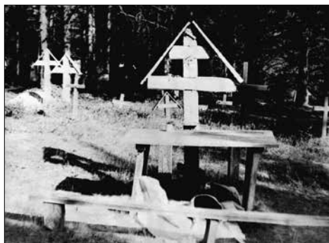
Фото 1. Поминальный крест на деревенском кладбище. Республика Коми, Усть-Куломский р-н, д. Кекур. 2001 г.