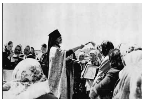
Фото 6. Молебен с водосвятием возле памятного креста на месте часовни иконы Тихвинской Божьей Матери. Республика Коми, Усть-Куломский р-н, с. Мыелдино. 2001 г.