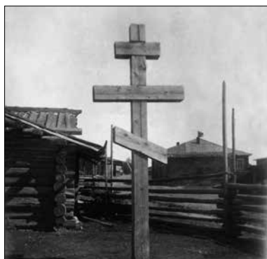
Фото 8. Охранительный крест. Коми Автономная область, Усть-Куломский р-н, с. Дон. 1935 г.