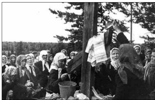
Фото 13. Молебен с водосвятием возле креста у «Источника явления Божьей Матери». Коми АССР, Усть-Куломский р-н, с. Усть-Кулом.