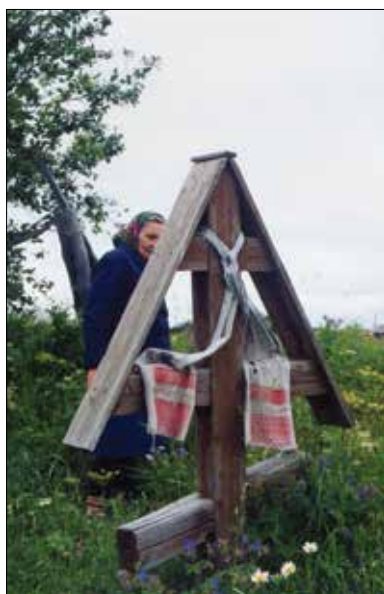
Фото 12. Крест св. вмч. Параскеве. Республика Коми, Удорский р-н, с. Чупрово. 2002 г.