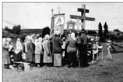
Фото 4. Молебен с водосвятием возле памятного креста на месте часовни иконы Тихвинской Божьей Матери. Республика Коми, Усть-Куломский р-н, с. Мыелдино. 2001 г.