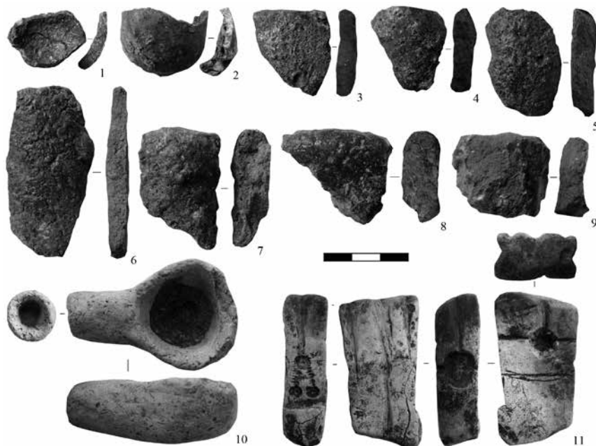
Рис. 2. Кушманское городище Учкаикар. Литейный инструментарий внешней части. 1–9 – фрагменты тиглей; 10 – льячка; 11 – форма литейная. Материал: 1–10 – глина; 11 – камень.

Учетные обозначения: 1 – 1022, уч. DK 27, гл. 16160; 2 – 1060, уч. DK 27, гл. 16160; 3 – 1059, уч. DH 25, гл. 16125; 4 – 937, уч. DJ 25, гл. 16135; 5 – 992, уч. DJ 28, гл. 16169; 6 – 2455, уч. DJ 27, гл. 16098; 7 – 2771, уч. DI 25, гл. 16029; 8 – 3328, уч. DI 25, гл. 16039; 9 – 1026, уч. DJ 26, гл. 16142.