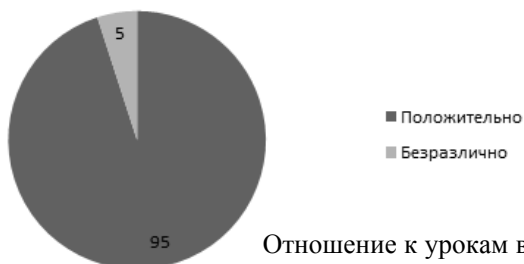
Отношение к урокам в музее

1. 95 % студентов положительно относятся к проведению уроков в музее; 5 % – безразлично: