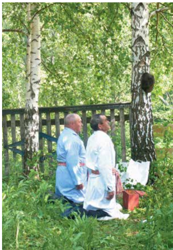
Коленопреклоненные жрецы произносят молитву на мѡр вѡсь. С. Новые Татышлы Татышлинского р-на РБ. 2013 г.