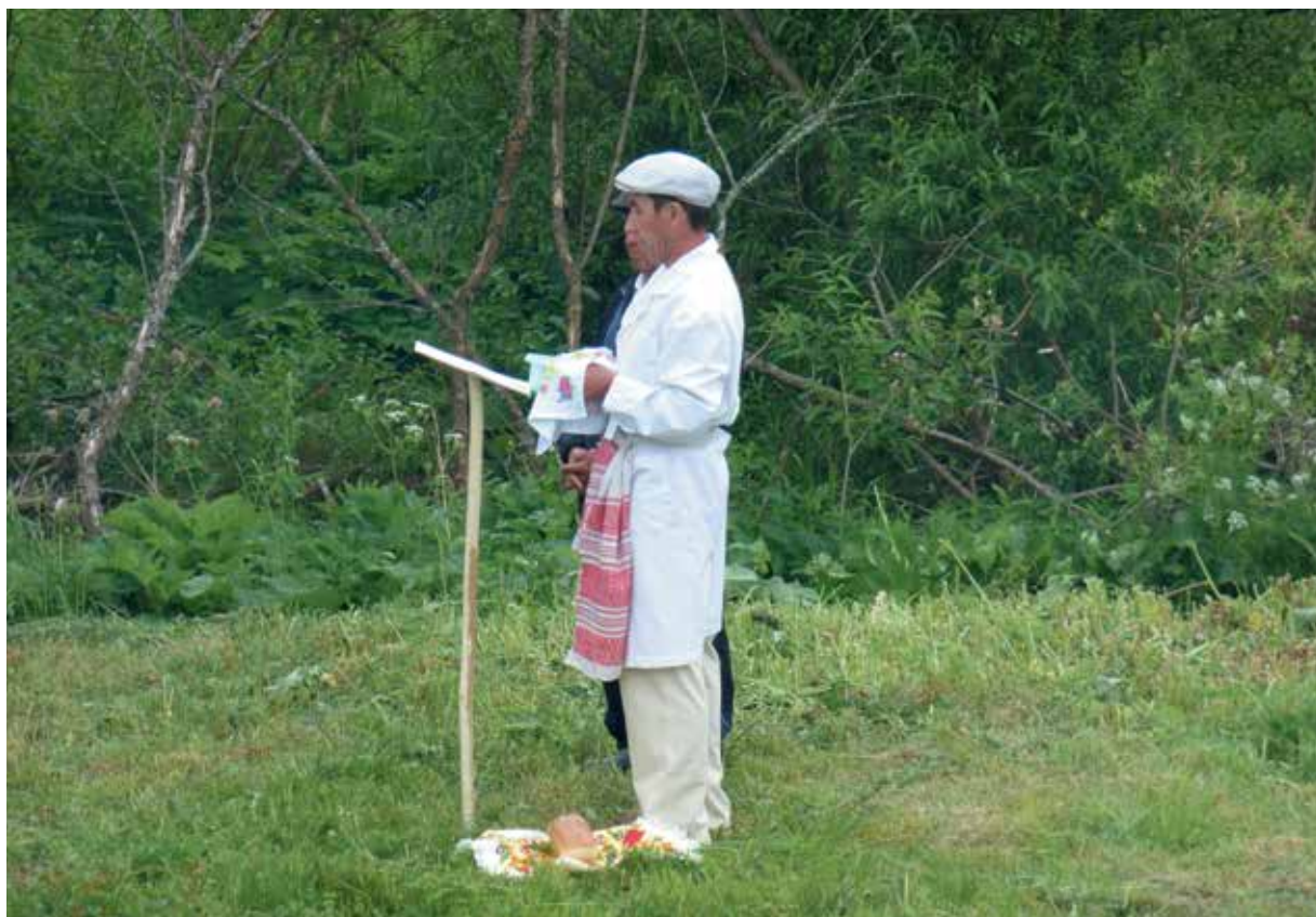
Жрец из д. Уразгильды Татышлинского района РБ с приспособлением для чтения молитвы. 2014 г.