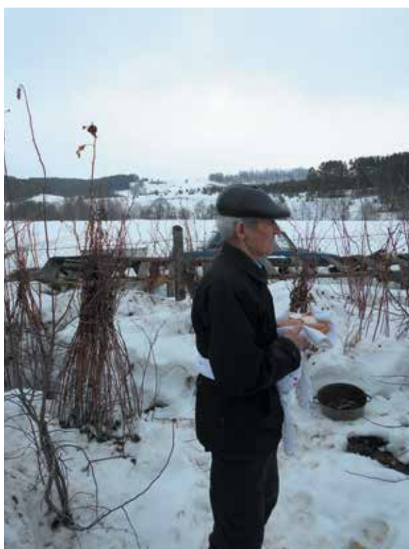
Произнесение молитвы на куала куриськон (моление в куале). Д. Алтаево Бураевского р-на РБ. 2018 г.