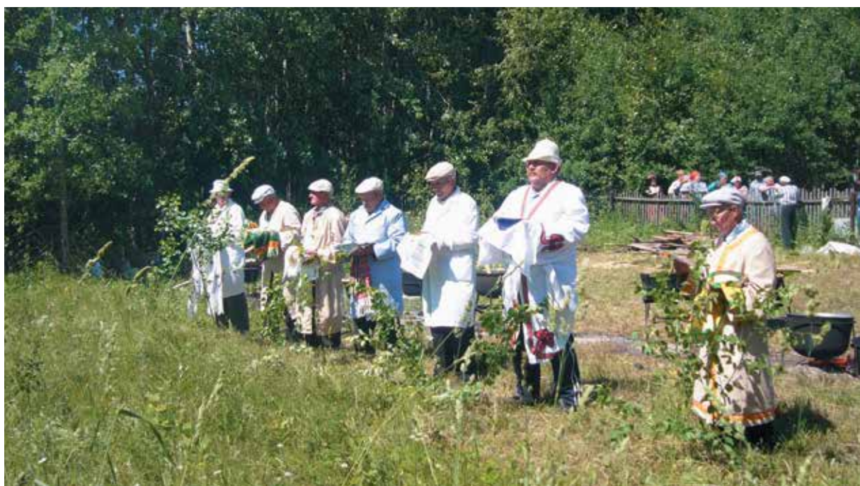
Жрецы на молении элен вѡсь. С. Кирга Куединского р-на Пермского края. 2013 г.