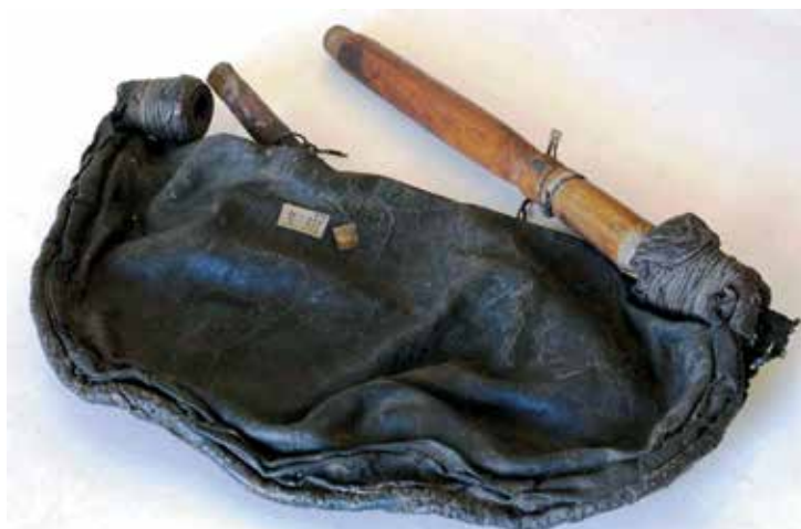
Рис. 1. Волынка (быз). XIX в.

Вятская губерния, Глазовский уезд [НМУР УРМ-1200]