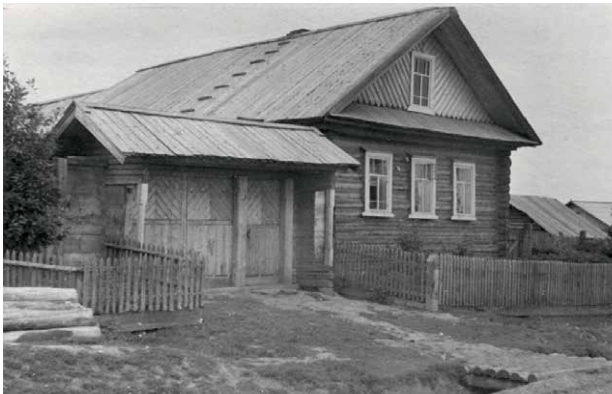
Рис. 3. Тип бесермянской избы. Август 1962 г. УАССР, Балезинский район, с. Большая Юнда