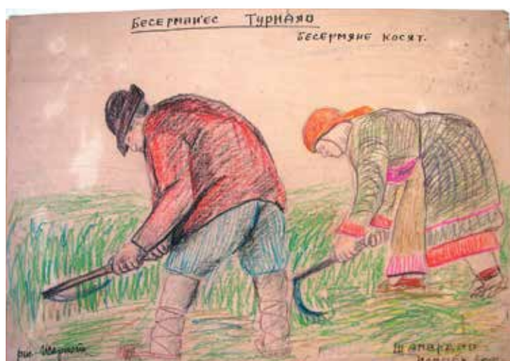
Рис. 2. Жаркопи(?), Сидоров Г.Ф. (?) «Бесермяне косят» («Косьба косой-горбушей»). 1931 г. ВАО, Юкаменский район, д. Шамардан [НМУР НВ-3353]

Вятская губерния, Глазовский уезд [НМУР УРМ-1200]