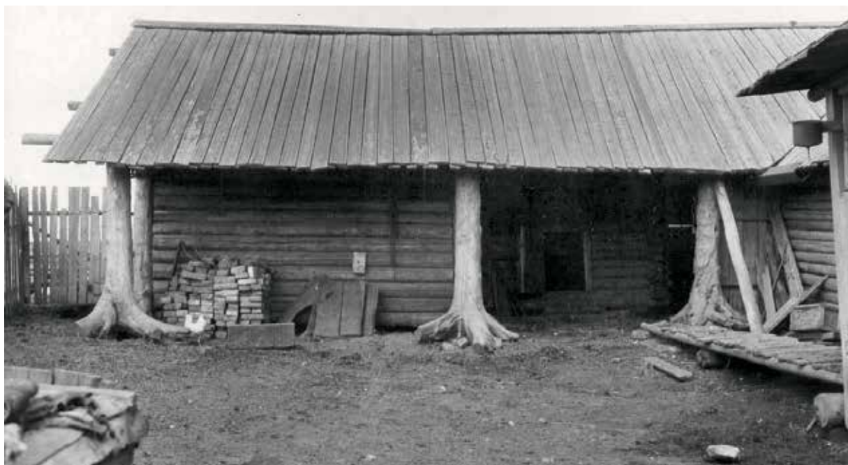
Рис. 4. Часть двора в усадьбе Зянкиной М. В. Июль 1979 г. УАССР, Юкаменский район, д. Филимоново [НМУР УРМ-13956-23]

Среди описанных предметов Пышкетского музея отметим черкыстон – приспособление для изготовления веретена; нянь шуккон – приспособление для обкатывания теста и придания ему определенной формы; гондыр кутон – рогатина как орудие, с которым охотники ходили на медведя; рыбацкая корзина из колотой ивы. Описаны также пазник – бондарный инструмент для выделывания выемки в дне бочки; чок – вешалка для одежды; пукон – складной стул из узких реек; табань квашня – емкость для замешивания теста; путы для лошади; янчик – кисет, который девушка дарила