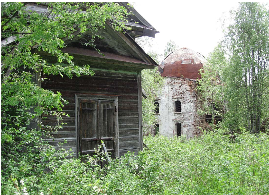
Рис. 3. Современный вид Шимозерского погоста. Церкви: Георгиевская (деревянная) и Знаменская (каменная). Фото А. А. Башкарева, 2012 г.

В фокусе нашего внимания оказался Шимозерский Знаменский приход, носивший двойное наименование: первое по названию местности, где он располагался; второе – по названию главной погостской церкви. На погосте располагались две церкви: Георгиевская (деревянная), по клировым ведомостям возведенная в 1600 г. неизвестно кем, и Знаменская (каменная), построенная в 1808 г. (рис. 3). Приход был довольно большой, в него входило 30 деревень [Овчинникова 2019].