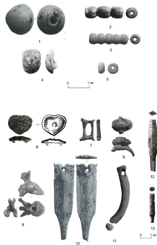
Рис. 2. Вещевой комплекс из слоев раннего хронологического горизонта. 1 – 5 – бусины; 6 – сердцевидная бляха; 7 – рамка от пряжки; 8 – перстень; 9 – зооморфный амулет; 10, 13 – копоушки; 11 – предмет неясного назначения; 12 – наконечник стрелы. 1 – 5 – стекло; 6, 7 – цветной металл; 8 – цветной металл, стекло; 9 – 13 – кость

часть заполнения рва. Этот грунт представляет собой материковую глину с различными включениями, взятую для заполнения городен при возведении оборонительной стены и высыпавшуюся в ров при его разрушении (горизонты А1 и Б заполнения рва) [Журбин и др. 2018, 38–45]. Найденные в них вещи могли попасть туда только во время строительных работ. Эти находки представлены многочастной пронизкой из желтого стекла, обломком желтой стеклянной бусины с реснитчатыми глазками, 1 экз. желтого бисера, прямоугольной рамкой восьмерковидной пряжки, костяной орнаментированной копоушкой, костяным зооморфным амулетом в виде изображения медведя, обломком неясного костяного изделия (рис. 2, 3–5, 7, 9–11).