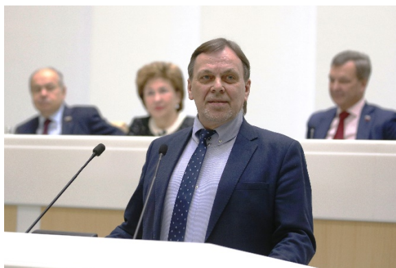
Рис. 1. А. В. Головнёв. 2021 г. Выступление на Совете Федерации Федерального Собрания Российской Федерации

«Россия – самая северная страна планеты по расположению, природе и культуре. Будучи естественным Севером России, Север никогда не выступал ее основным измерением, отодвигаясь на окраинный план и оставаясь в тени ориентаций на европейский Запад, ордынский Восток, византийско-христианский Юг. Между тем именно северность предопределила самобытность России исторически (начиная с ключевой роли Ладоги и Новгорода в древности), экономически (с учетом пушнины, нефти, газа, золота и других ресурсов) и геополитически (ввиду пространственного преобладания в высоких широтах)» [Головнёв 2022, 2].