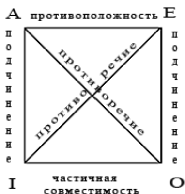
Рис. 1. Логический квадрат [1. С. 143]

Д. Курзон, подобно Р. Якобсону, исследует молчание в контексте звука и шума. Отталкиваясь от тезиса об оппозиционных отношениях молчания и речи, Д. Курзон обращается в качестве основы для своих рассуждений к логическому квадрату (рис. 1) – схеме, выражающей отношения с точки зрения истинности и ложности между общеутвердительным и общеотрицательным, частноутвердительным и частноотрицательным суждениями [1. С. 143-146].