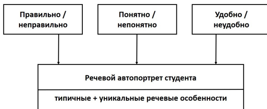
Рис. 2. Речевой автопортрет студента как комплекс

4. В речевых автопортретах студентов представлены следующие противопоставления: правильно – неправильно, понятно – непонятно, удобно – неудобно (см. рис. 2).