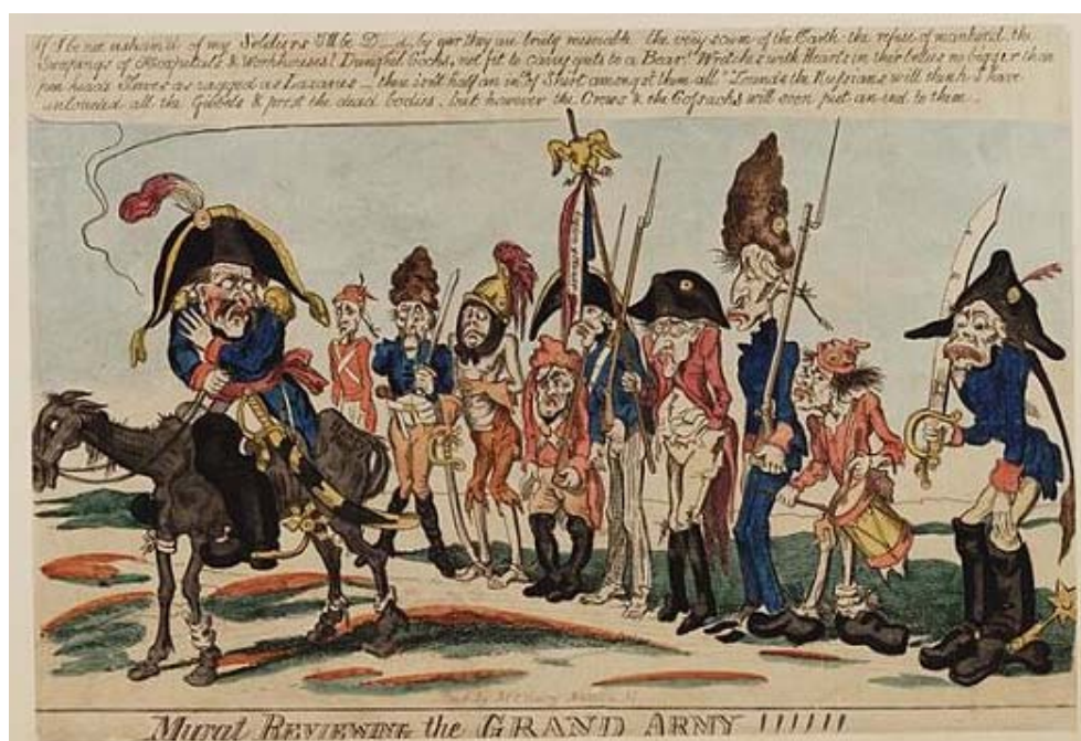
Рис. 11. «Мюрат инспектирует Великую армию», 1813

На смену творчеству Дж. Гилрея и его последователей приходит новая плеяда карикатуристов во главе с Джорджем Крукшенком 4 . Ключевыми темами его карикатур были закат эпохи Наполеона и бедствия французской армии в России. В конце 1812 – начале 1813 гг. вышли в свет карикатуры, изображающие разбитую и замерзающую французскую армию, а также бросившего её на произвол судьбы Наполеона. Карикатура Крукшенка «Император Бони сбегает из Лейпцига под прикрытием»