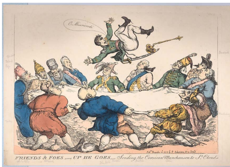
Рис. 6. «Друзья и враги – вверх его! Корсиканского Мюнхгаузена отправляют в Сен-Клу», 1813

Карикатура «Друзья и враги – вверх его! Корсиканского Мюнхгаузена отправляют в Сен-Клу» (см. рис. 6) [8] повторяет сюжет карикатуры Дж. Гилрея пятилетней давности, только вместо испанского быка Наполеона на простыне подбрасывают представители европейских держав, демонстрируя ликование по поводу освобождения Европы.