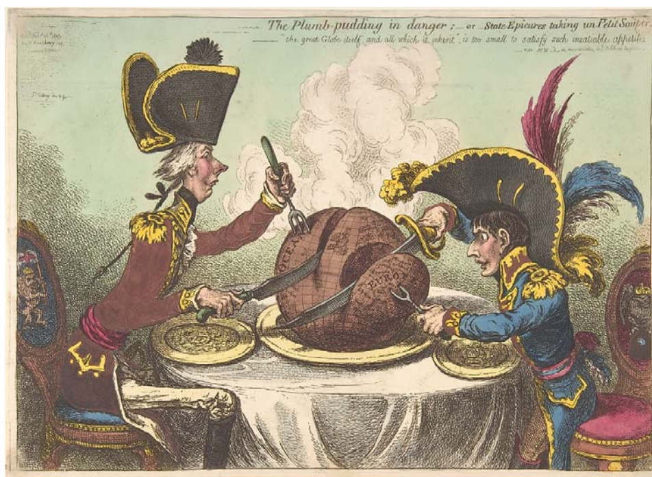
Рис. 3. «Плам-пудинг в опасности, или Ужин государственных гурманов», 1805

Одной из самых известных сатирических работ на эту тему является карикатура «Плам-пудинг в опасности, или Ужин государственных гурманов» (см. рис. 3) [13]. Наполеон и премьер-министр Великобритании У. Питт-мл. делят земной шар: каждый пытается отхватить свой кусок «пирога». Британский премьер-министр изображен более сдержанным, Наполеон напротив импульсивен. В данной карикатуре типичные по другим работам черты образа французского императора приобретают еще более гипертрофированный масштаб: его миниатюрность, особенно подчеркнутая его гротескно большой шляпой, а также его хищный взгляд.