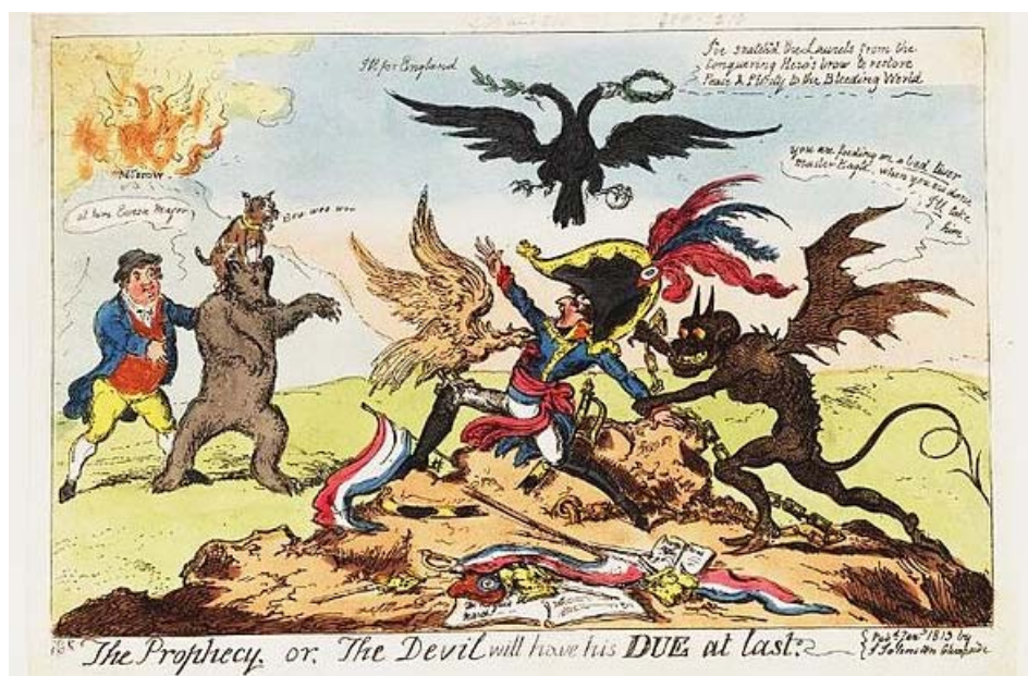
Рис. 10. «Пророчество, или В конце концов дьявол возьмет свое», 1813

Особое место в творчестве Дж. Гилрея занимала личная жизнь Наполеона, например, в карикатуре «Бони и его новая жена, или Перебранка из-за НИЧЕГО» (см. рис. 7) [6], а также «Успешный охотник за удачей» (см. рис. 8) [15].