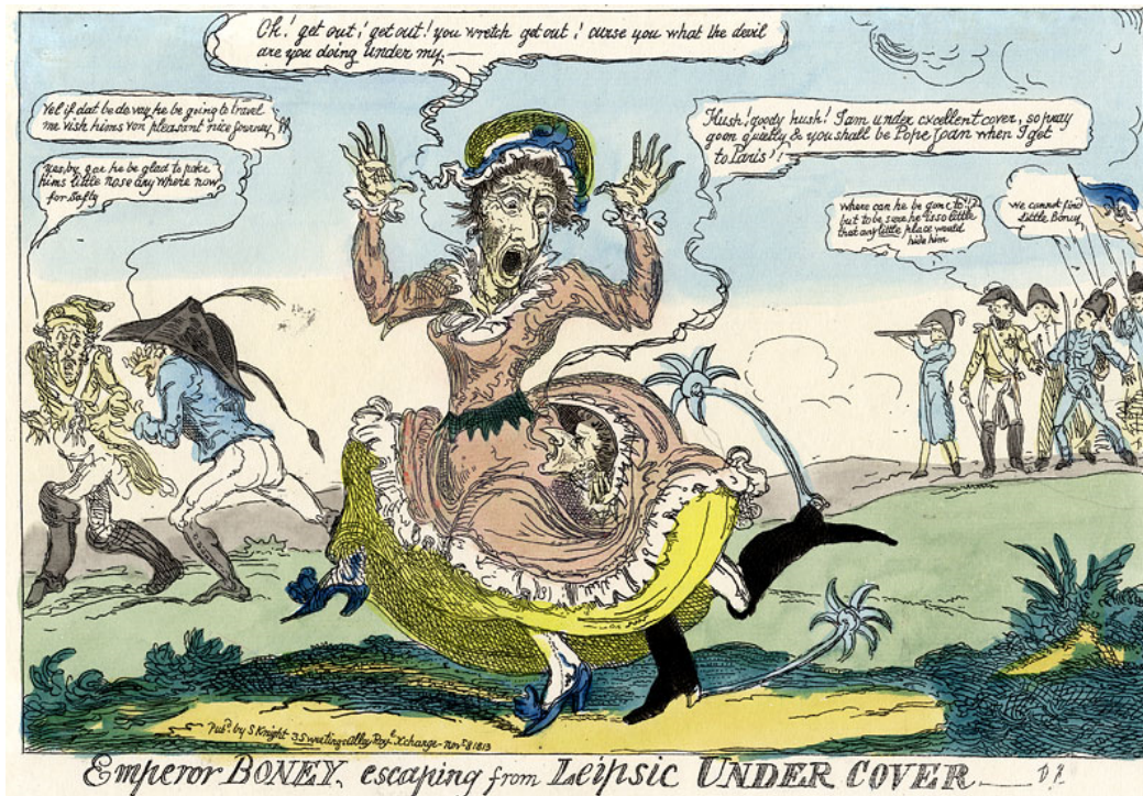
Рис. 9. «Император Бони сбегает из Лейпцига под прикрытием», 1813