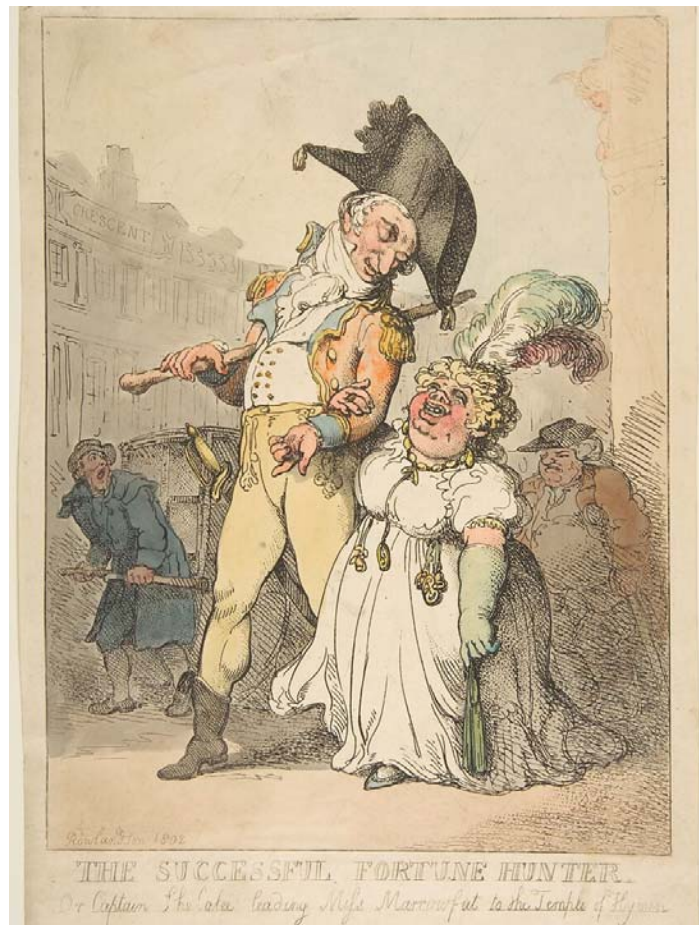
Рис. 8. «Успешный охотник за удачей», 1802