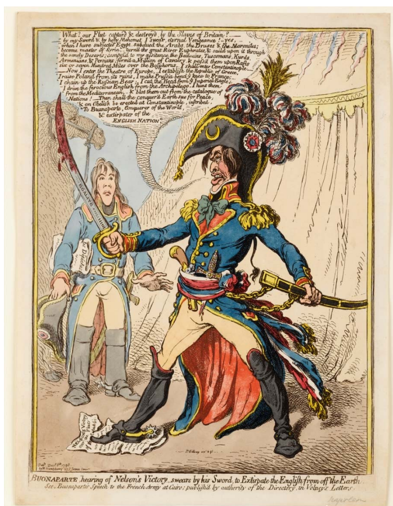
Рис. 1. «Бонапарт, услышав о победе Нельсона, клянется своим мечом стереть англичан с лица земли», 1798

Отличительной чертой английской карикатуры является то, что они были более тщательны и детализированы, чем карикатуры, издававшиеся в других странах. Этот вид художественного творчества предполагал знание политических событий и основных игроков на политической арене. Их историческая уникальность заключалась в том, что они демонстрировали интерес общества к той или иной политической теме, отражая актуальные политические дебаты. Немаловажную роль играло и то, что почти все карикатуры были подписаны и датированы. Британские карикатуристы не только давали быструю реакцию на события, происходившие в Великобритании, но и в мире. Эту особенность впоследствии использовало британское правительство, в том числе и для формирования британской идентичности на основе враждебности к французам. Значение и важность карикатуры в создании определенных образов эпохи подчеркивал британский историк Дж. М. Тревельян [4, с. 509].