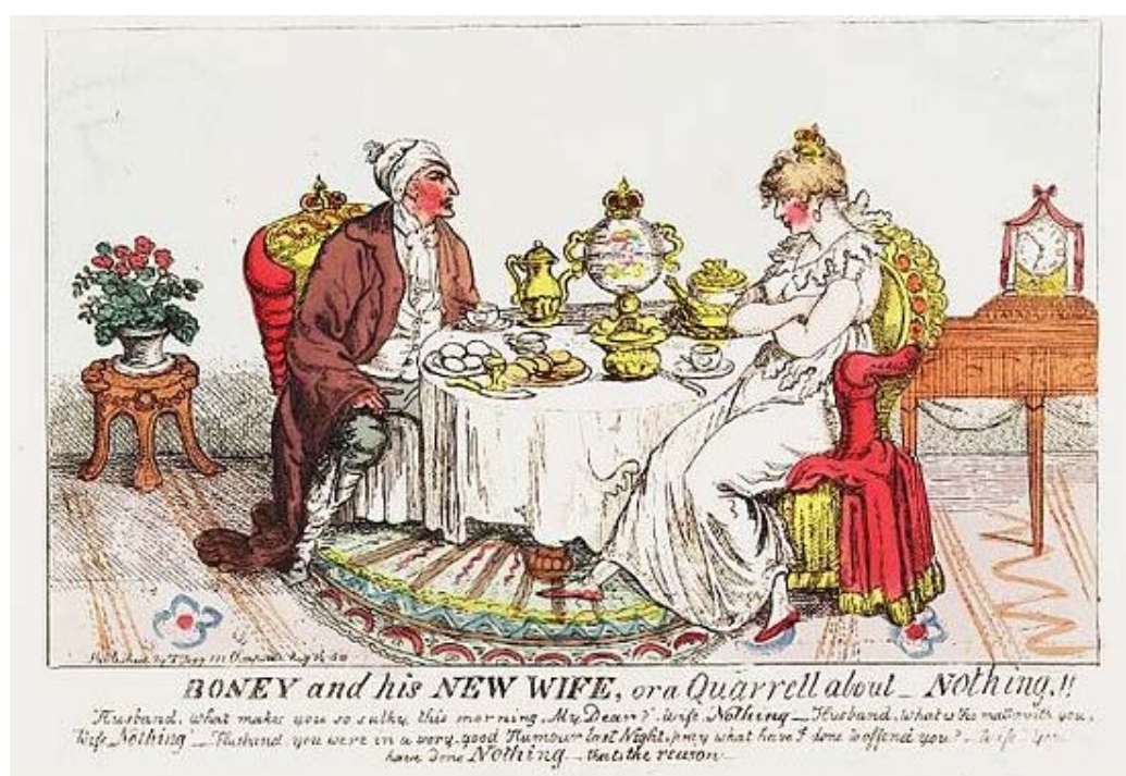
Рис. 7. «Бони и его новая жена, или Перебранка из-за НИЧЕГО», 1810