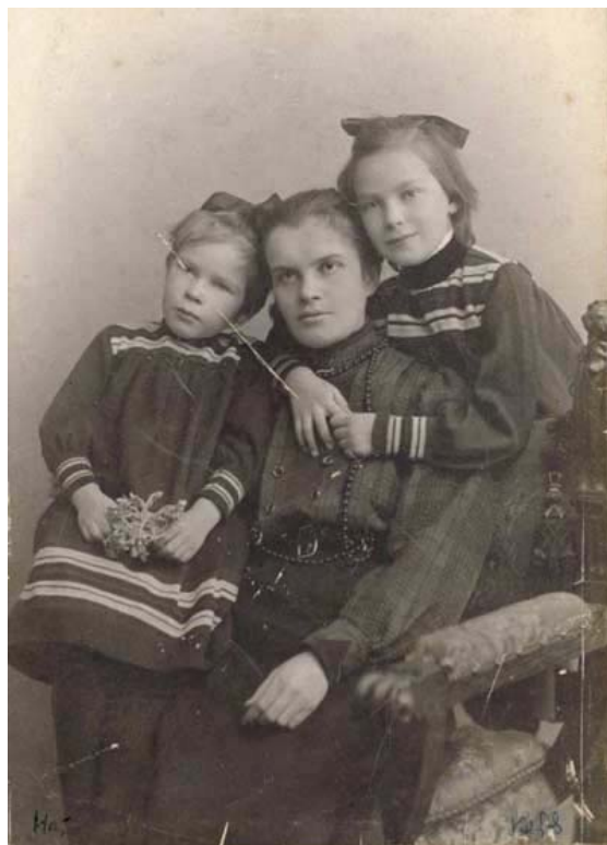
Фото 3. А.М. Распутина с дочерьми (1907 г.)

Эти впервые публикуемые строки, преисполненные заботой о малышках и искренней материнской любовью, обречённой, но убеждённой в своей правоте личности, и сейчас звучат трогательно и пронзительно и обращают нас к фотоснимку, на котором мать уже воспринимается как жертвующая собой страстотерпица: