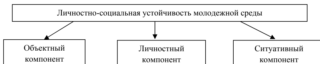
Рис. 1. Блоки методики определения личностно-социальной устойчивости молодежной среды

Согласно выявленным нами компонентам личностно-социальной устойчивости была составлена структура методики (рис. 1).