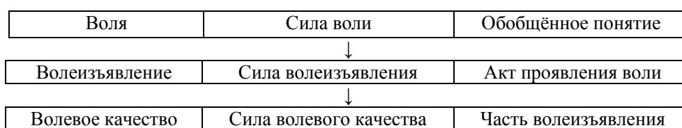
Рис. 1. Взаимосвязь волевых понятий

Если научиться измерять силу волевого качества в числовой форме и в унифицированном масштабе мер, то имея формулу связи волевых качеств с силой волеизъявления, можно находить и последнюю величину, т. е. текущее значение силы воли. Усредняя текущие значения, можно прийти к числовому выражению абстрактной силы воли индивида.