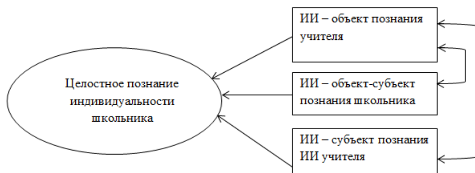
Рис. 2. Интегративная модель целостного познания индивидуальности школьника

Виртуально этот процесс можно представить как слияние отдельных информационных кейсов в едином процессе целостного познания индивидуальности школьника педагогом (см. рис. 2).