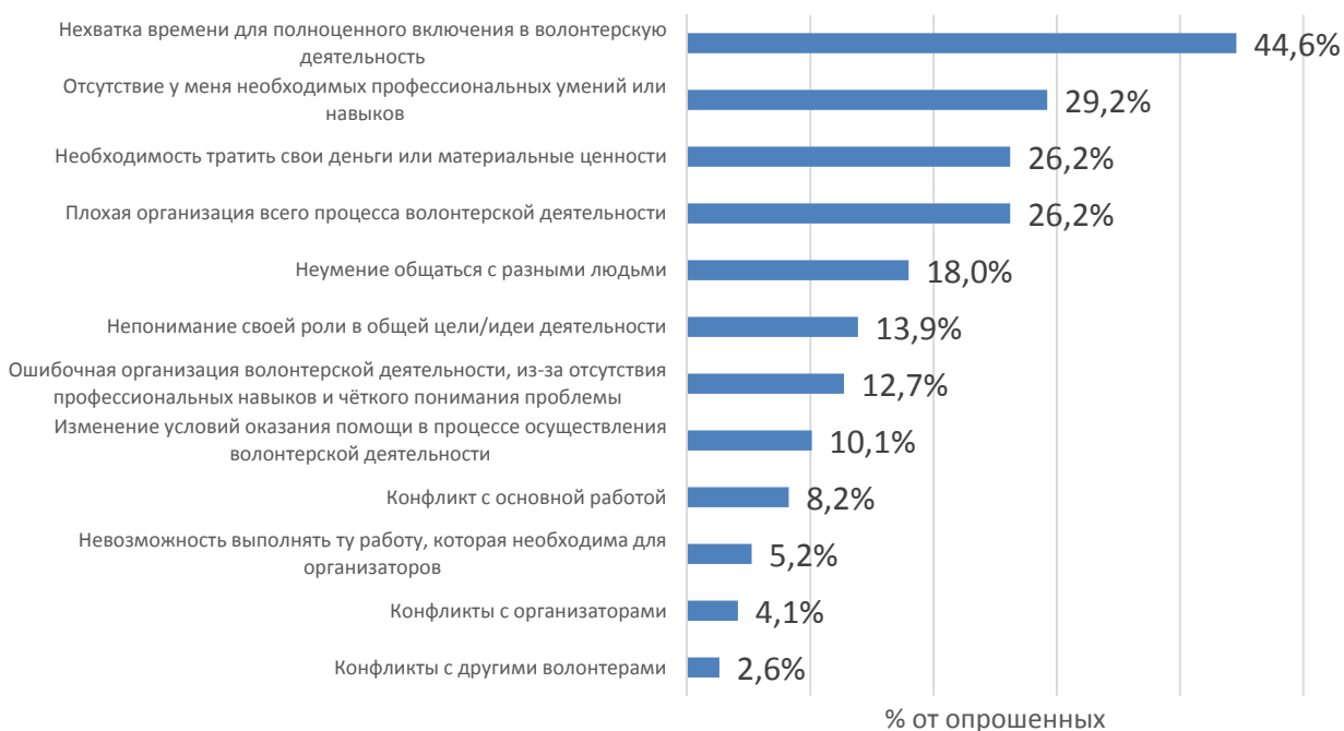
Рис. 4. С какими трудностями Вы сталкивались, когда участвовали в мероприятиях/акциях в качестве волонтера? (Один респондент мог выбрать несколько вариантов ответов)

Общая ориентация на помощь другим и потребность в самореализации встречаются с определенными трудностями при реализации волонтерской активности. Ввиду того, что волонтерское движение в институционализированном виде существует менее 10 лет, вполне предсказуемо, что для него характерен целый спектр проблем, которые могут быть связаны с различными основаниями. Необходимо отметить, что первые две проблемы носят в первую очередь личностный характер и выражаются в нехватке времени для волонтерской деятельности и отсутствии необходимых профессиональных навыков, но за этими проблемами следуют сложности, носящие институциональный характер: необходимость тратить свои деньги и плохая организация самого процесса осуществления помощи и поддержки. Остальные проблемы были обозначены менее чем 1/5 опрошенных респондентов (см. рис. 4).