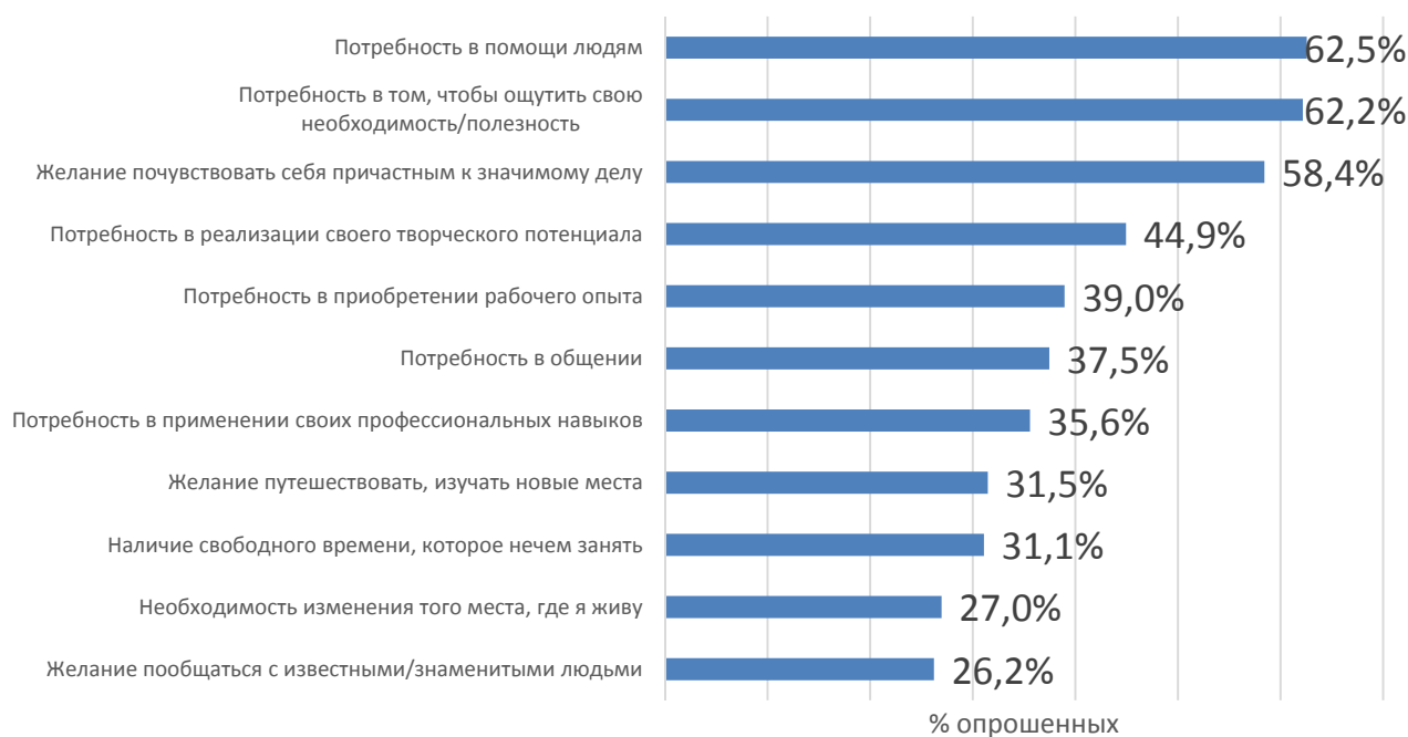
Рис. 3. По какой причине Вы участвуете в волонтерской деятельности? (Один респондент мог выбрать несколько вариантов ответов)