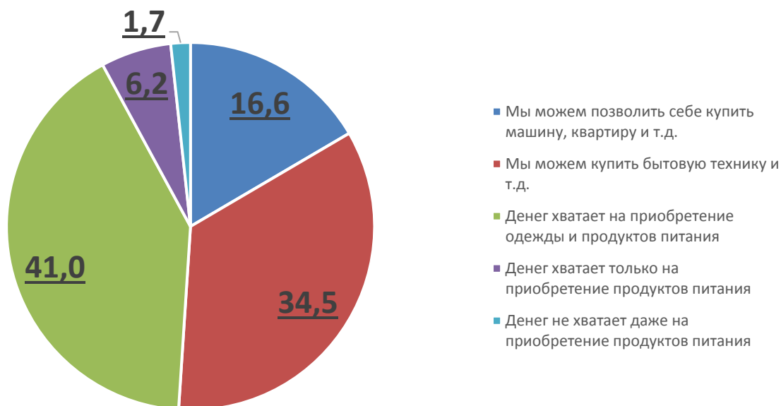
Рис. 1. Материальное положение респондентов, принявших участие в исследовании (% от опрошенных)

Таким образом, в исследовании приняли участие 13,4 % мужчин и 86,6 % женщин. По данным, полученным в результате опроса, можно говорить о преобладании женской аудитории среди волонтеров (значительное преобладание женщин в опросе может быть связано с традиционным большим уровнем их участия в исследованиях). Возраст респондентов распределялся крайне неравномерно: 2,1 % не достигли 14 лет, 39 % опрошенных находились в возрасте от 14–17 лет, 22,4 % – 18–22 года, 4,8 % – 23–25 лет, 6,9 % – 26–30 лет, 24,8 % – старше 30 лет. Подобная возрастная структура накладывает свой отпечаток на характер занятости, уровень образования и состав семьи. Подавляющее большинство респондентов не состояли в браке (66,9 %), еще 29 % респондентов состояли в зарегистрированных или незарегистрированных отношениях. У 74,5 % респондентов не было детей, 25,5 % заявили об их наличии. Лишь 1/3 опрошенных респондентов имеют законченное высшее образование, более 60 % учатся в настоящий момент. В целом, учитывая зависимый характер материального положения большинства участников опроса, можно констатировать декларативно средний и высокий уровень дохода среди респондентов (см. рис. 1).