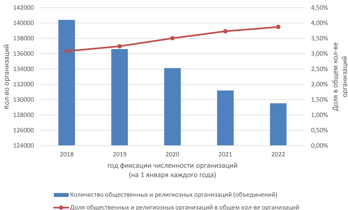
Рис. 2. Количество общественных и религиозных организаций (объединений) и их доля в общей численности организаций по годам (на 1 января каждого года по данным Федеральной службы государственной статистики)