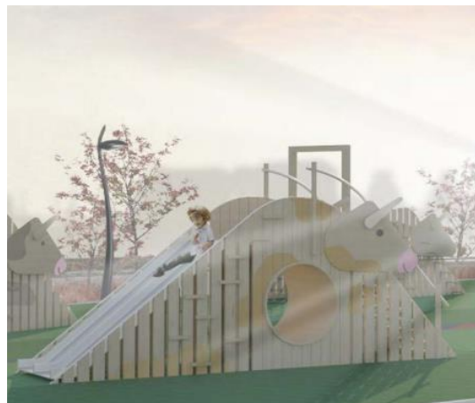
Рис. 2 Детская зона в виде «алааса»