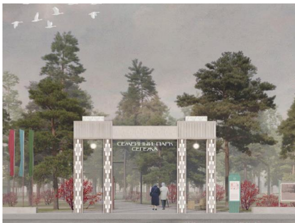
Рис. 9 Оформление входных ворот «Семейного парка «Сегежа», Карелия (конкурс 2021 г.)

Например, в основу паттернов айдентики проектов реконструкции парков культуры и отдыха в г. Сегежа и г. Медвежьегорск, Республика Карелия (конкурс 2021 г.) положены адаптированные карельские и карельско-финские узоры, используемые для оформления причёлин, а также вышивки полотенец (см. рис. 9 и 10). Во всех малых архитектурных формах и в дизайне навигационных элементов проекта «Фетовский сквер» г. Мценск Орловской области (конкурс 2021 г.) находят применение образы мценского кружева (см. рис. 11).