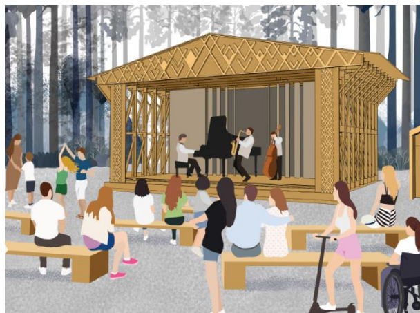
Рис. 10 Визуализация сцены. Проект благоустройства городского парка, г. Медвежьегорск, Карелия (конкурс 2021 г.)