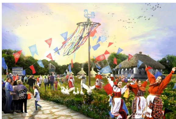
Рис. 16 Строение в виде казачьего куреня. Проект благоустройства парка в г. Фролово Волгоградская область (конкурс 2019 г.)