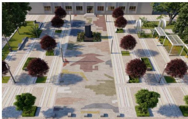
Рис. 12 Проект благоустройств площади г. Фатеж (конкурс 2021 г.)

В некоторых проектах исторически характерные, по мнению авторов концепций, для определенной местности орнаменты воспроизводятся также в мощении улиц и площадей. Например, для мощения площади г. Фатеж используется рисунок традиционного фатежского ковра (см. рис. 12), а рисунок мощения площадки перед краеведческим музеем г. Пестово разработан на основе образцов пестовской (народной новгородской) вышивки. Важное место в проекте «Северные ворота Башкортостана» (г. Янаул, конкурс 2020 г.) отводится мощению пешеходного, проходящего по городскому центру, маршрута в виде ковровой дорожки, вышитой красными башкирскими узорами: «ковер с узорами, проходящий по всей территории проектирования, формирует единый и дружелюбный образ центра Янаула» 5 (см. рис. 13).