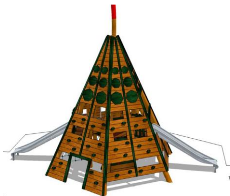
Рис. 14 Элемент детской площадки в проекте благоустройство сквера Космонавтики с прилегающей территорией в г. Оленегорске (конкурс 2020 г.)

Одним из архитектурных решений благоустройства городской набережной г. Певек Чукотский автономный округ (конкурс 2020 г.) является мангальная беседка, выполненная в форме «жилища коренных народов округа юкагиров и чукчей, центром которого был очаг, а в кровле располагалось отверстие для выхода дыма» (см. рис. 17). Помимо способа передачи идентификационных образов и декоративной функции, рассмотренные сооружения и малые архитектурные формы зачастую имеют и утилитарную функцию, являясь, например, детскими игровыми и спортивными сооружениями.