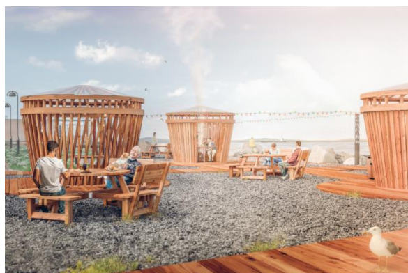
Рис. 17 Проект мангальных беседок в проекте благоустройство городской набережной» в г. Певек Чукотской автономный округ (конкурс 2020 г.)

К отдельному, третьему подтипу второй группы проектов, можно отнести проекты, согласно концепциям которых в качестве этнических категорий являются фольклорные или этнографические персонажи. Например, в основе проектного решения по благоустройству г. Новосиль Орловской области (конкурс 2021 г.) лежит комплекс значимых для местных жителей объектов и символов, состоящих из национальных костюмов, геральдики, а также Чернышинской игрушки. Каждый из этих элементов рассматривается как прообраз для орнаментов, которые могут использоваться и как стили-