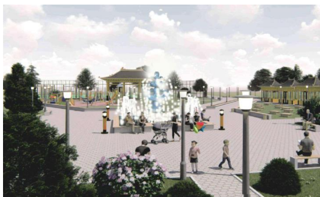
Рис. 15 Центральная площадь парка в проекте благоустройство парка «Мелодии Каспия» г. Лагань Республика Калмыкия (конкурс 2021 г.)