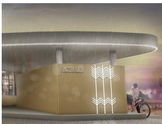
Рис. 4 Декоративные элементы в виде стрел

Подобная логика свойственна и дизайн-коду проекта «Парк культуры и отдыха имени Сергея Васильева» г. Нюрба, Республика Саха (Якутия) (конкурс 2019 г.), в основу которого также взят, как обозначено в материалах проекта, «культурный код народа Саха». Во-первых, для реализации проекта выбрана территория, где каждое лето проводится якутский летний праздник Ысыах. На центральной площади устанавливается арт-объект «Яичное дерево», идею которого заимствовали в местной легенде. Кроме того, дерево несет сакральный смысл в якутской культуре в целом. Архитектурные сооружения и другие малые архитектурные формы располагаются по кругу, по ассоциации с формой солнца, которое считается оберегом.