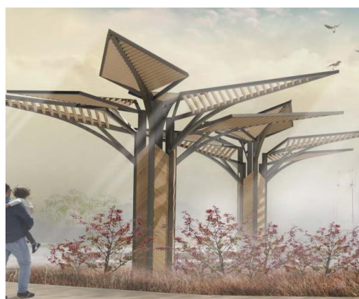
Рис. 3 Навесы в форме полевых цветов