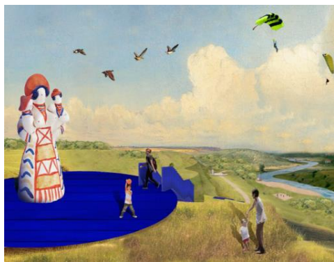
Рис. 18. Проект благоустройства г. Новосиль Орловская область (конкурс 2021 г.)

образующие элементы городского дизайна, и как основа для сувенирной продукции (см. рис. 18). Подобным художественно-декоративным элементом малых архитектурных форм можно считать фигуры и изображения персонажей русских народных сказок (например, Баба-яга, медведь, избушки на курьих ножках, ежики и пр.), а также фигуры и изображения мифологических персонажей, либо животных ассоциируемых авторами проектов с традиционным образом жизни и фольклором определенного народа. Так, в проекте благоустройство сквера Космонавтики в г. Оленегорске Мурманская область (конкурс 2020 г.) активно используется образ оленя в комбинации с другими саамскими образами «как образ милосердного божества солнца Пейве», а также силуэт традиционного саамского жилища (см. рис. 19).