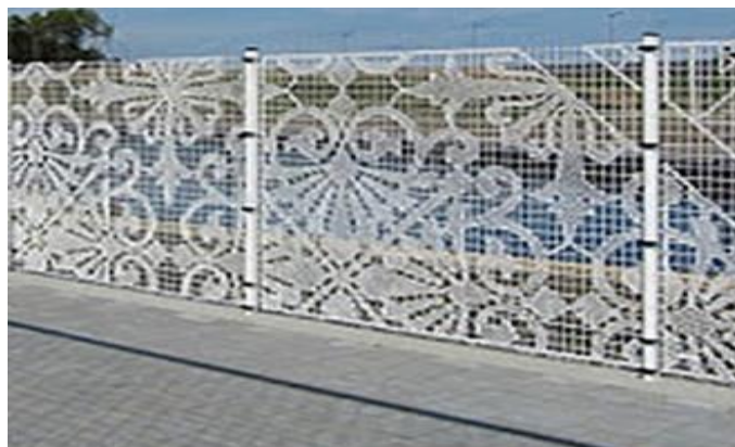
Рис. 11 Ограждение с кружевным орнаментом из сетки рабицы. Проект «Фетовский сквер», г. Мценск Орловская область (конкурс 2021 г.)