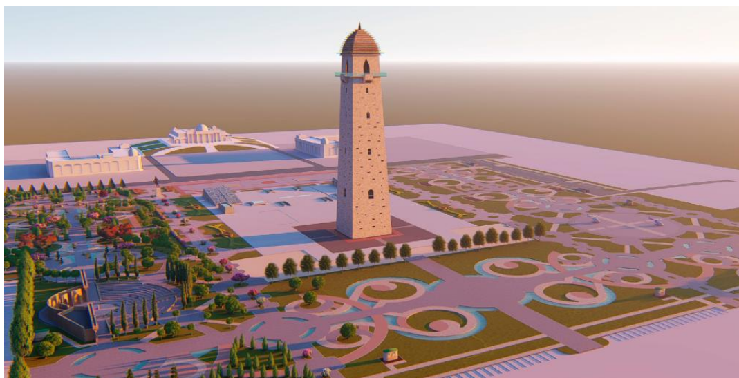
Рис. 6 Дизайн-проект по благоустройству и озеленению центральной части г. Магас Республика Ингушетия (конкурс 2018 г.)

находится башня Согласия, архитектурное сооружение в виде древнеингушской боевой башни высотой почти 100 метров. Ландшафтный дизайн парка озеленения продуман так, чтобы с высоты башни были видны круги разбивки парка. Круги ассоциируются с солнцем, точнее с солярным знаком с тремя завитками, направленными против часовой стрелки, который, согласно авторам проекта, является символом ингушского народа. В дизайне также использованы трикветры как символы трех высших ценностей ингушей: веры, знания и добродетельного поведения (см. рис. 6).