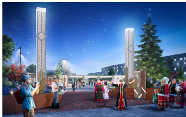
Рис. 13 Проект «Северные ворота Башкортостана». г. Янаул Республика Башкортостан (конкурс 2020 г.)

Важно еще раз подчеркнуть, что включение этнических или этнографических орнаментов в дизайн, либо в конкретные архитектурные решения концептуально обосновывается не только их декоративными функциями, но и тем, что орнаменты имеют глубокое символическое значение для репрезентации локальной идентичности. Например, декоративной основой архитектурной концепции проекта благоустройства парка Покровский и набережной р. Самариха в г. Шахунья Нижегородской области (конкурс 2020 г.) являются тканые народные узоры, интерпретируемые как символы «передачи знаний и силы рода от родителей к детям, гармоничных семейных отношений, переплетения человеческих судеб». 6