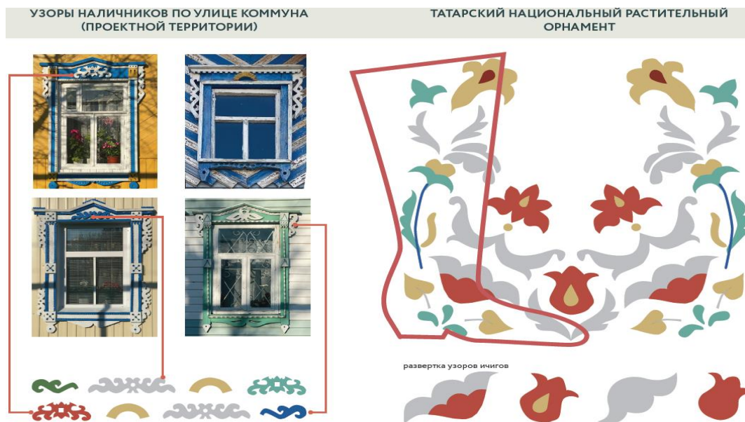
Рис. 5 Айдентика, иллюстрирующая архитектурную и градостроительную концепцию проекта «ТатАрские предания» г. Арск Республика Татарстан (конкурс 2021)

Второй подтип визуализации этничности свойственен проектам, архитектурная концепция которых основана на использовании отдельных, наиболее ярких по мнению авторов, исторических, фольклорных, этнических, культурных, природных характеристик народа, проживающего на территории реализации проекта. Например, обоснование проекта «ТатАрские предания» в г. Арск Республики Татарстан (конкурс 2021 г.) начинается с тезиса о том, что Арск и для горожан, и для жителей республики, и для туристов является местом начала знакомства с татарской культурой, историей и бытом. Маршрут этого знакомства начинается с городского вокзала. Его архитектурное оформление разработано по ассоциации с характерными, с точки зрения авторов проекта, чертами традиционной татарской архитектуры, национального растительного орнамента, в том числе узоров на местной обуви, наконец, с творчеством татарских писателей-уроженцев города. Согласно опросу местных жителей, именно эти черты составляют ключевые ценности и городскую идентичность г. Арска. Используются элементы декора, характерные для фасадов домов. Перголы оформлены с использованием национальных узоров и характерных элементов декора фасадов домов. Узоры обуви нашли отражение в скамейках и лавках, в дизайне освещения, в мощении улицы (см. рис. 5). Цветовая композиция также основана на цветах, использовавшихся в производстве местной кожаной мозаики.