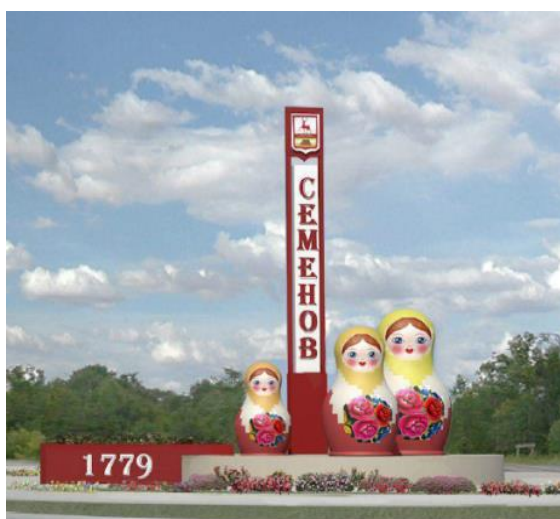
Рис. 7. Въездная стелла. Проект благоустройства ул. Заводской г. Семенов Нижегородская область (конкурс 2018)

Третий подтип, который можно условно обозначить как этнографический, чаще всего представлен проектами, предусматривающими использование культурно-локальных характеристик местного населения. Особенности этого подтипа хорошо видны на примере проекта благоустройства ул. Заводской г. Семенов Нижегородской области (конкурс 2018 г.), где ведущим декоративным и архитектурным элементом концепции является семеновская роспись, характерная для оформления деревянных игрушек, изготовление которых, в свою очередь, составляет основу местного древнего народного промысла с начала XX в. Орнамент и цветовое решение росписи – базовый мотив практически всех малых архитектурных форм и айдентики проекта в целом (см. рис. 7 и 8).