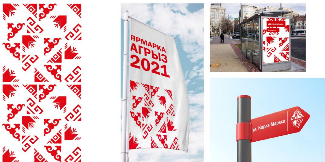
Рис. 21 Элементы айдентики проекта «Благоустройство улицы Карла Маркса» г. Агрыз, Республика Татарстан, конкурс 2021 г.

Наконец, можно выделить еще одну, четвертую группу проектов, которую условно можно обозначить, как маргинальную. Дело в том, что в концепциях этих проектов нет четких графических этнических символов, обозначающих определенный объект или субъект, или его признак. Логика обоснования концепции выстраивается на косвенных ассоциациях с этничностью. Иными словами, в концепциях этих проектов отсутствует прямая причинно-следственная связь, когда, например, солнце наделяется значением символа данного народа, соответственно, образ солнца используется в декоративном оформлении или в архитектурных решениях. Тем не менее этничность в них также играет концептуальную роль, только она скорее понимается как образная виртуальная идея, позволяющая соединить разные элементы концепции в единое целое. Например, в проекте по благоустройству части города Багратионовска в Калининградской области (конкурс 2021 г.) авторы стремятся создать новую «русскую архитектуру», основой которой является симбиоз из разного этнокультурного и архитектурного наследия города. Подобный подход, согласно авторам концепции проекта, можно назвать контекстуальным подходом к проектированию.