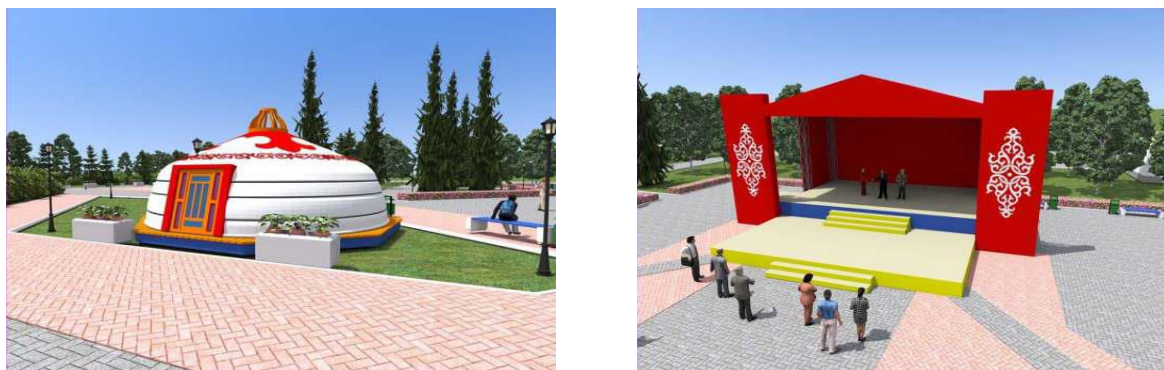
Рис. 20. Малые архитектурные формы в проекте по благоустройству парка в г. Туран Республика Тыва (конкурс 2021 г.).