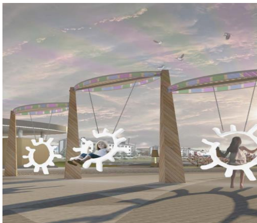
Рис 1. Качели в виде кругов

ки Бэйбэ рикээн» (см. рис. 2). Навесы вдохновлены формой полевых цветов из сказки (см. рис. 3), а в спортивной площадке идеей для формы декоративных элементов послужили стрелы героя сказки – Хаардыт Бэргэн (см. рис. 4). Айдентика проекта также дополняется элементами, отражающими традиционный образ жизни местных жителей. Дизайн круглогодичного павильона разработан в форме якутского балагана, некоторые другие малые архитектурные формы – в виде традиционной якутской мебели «олоппос», а светильники – в форме камелька.