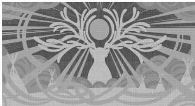
Рис. 19. Часть дизайна центрального навеса «Волшебная гора», проект Благоустройство сквера Космонавтики с прилегающей территорией в г. Оленегорске Мурманская область (конкурс 2020 г.)

Наконец, визуализация этничности происходит через цвет, используемый в оформлении ландшафта, в декоративных и архитектурных решениях. В нескольких конкурсных проектах цвет является одним из важных элементов обоснования всей концепции. В них использование того или иного цвета аргументируется, как правило, его традиционностью для данной местности и проживающего на ее территории народа. Например, в проекте благоустройства территории вокруг Свято-Вознесенского собора в г. Алагир Северная Осетия-Алания (конкурс 2021 г.) выбор для озеленения красных тюльпанов, кизильника и некоторых других растений объясняется тем, что характерные для них цвета являются цветами традиционной одежды осетин. В проекте создания комфортной городской среды в г. Можга «Сердце Можги» в Удмуртской республике (конкурс 2021 г.) оранжевый цвет в оформлении выбран из-за того, что он является цветом герба города и народных удмуртских нарядов. Подобная концептуальная ассоциация характерна и для проекта благоустройства в г. Медвежьегорск Республика Карелия (конкурс 2021 г.), согласно которой красный цвет используется в оформлении, поскольку он является традиционным для колористики заонежской вышивки.