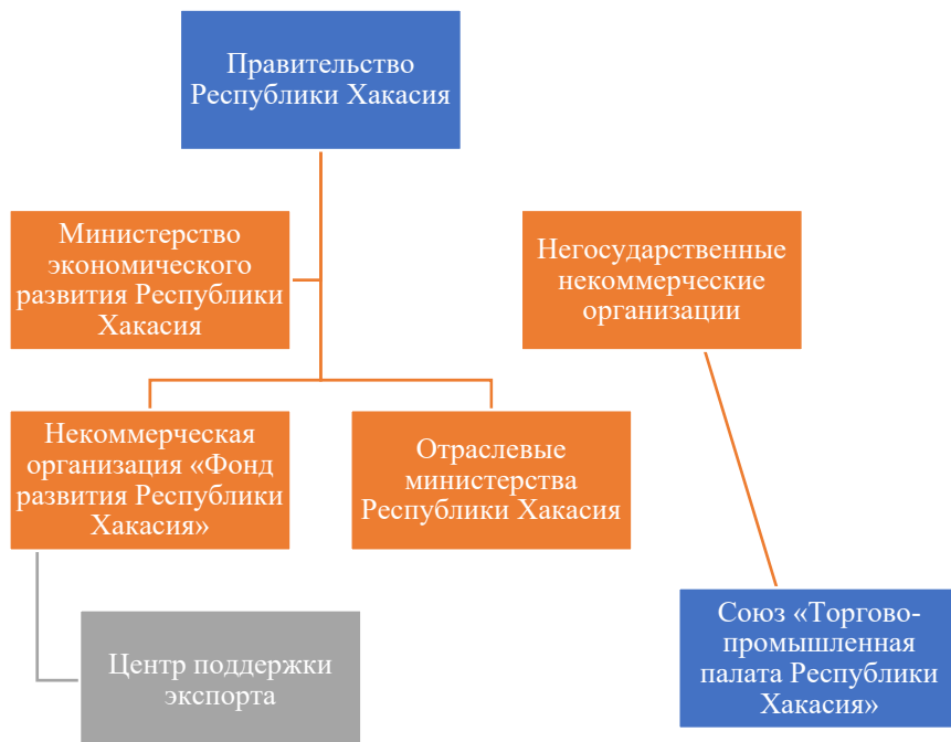
Рис. 1. Органы и организации, занимающиеся регулированием внешнеторговой деятельности Республики Хакасия

ческой деятельности региона, чего пока нет как официального документа в Республике Хакасия [12]. При Фонде развития Республики Хакасия создан центр поддержки малого бизнеса для правильного документооборота участников экспортной деятельности. Торгово-промышленная палата Республики Хакасия занимается интеграцией в мировую хозяйственную систему субъектов предпринимательства и международные отношения, в том числе культурные.